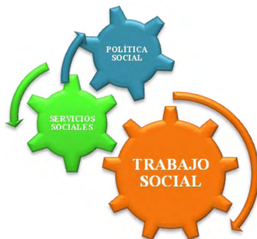
Gráfico 2: Relación entre el Trabajo Social, los Servicios Sociales y la Política Social como generadores de Bienestar .

Queremos conectar estos tres conceptos. No se entienden de manera separada. Han de estar en interconexión y armonía. Han de funcionar como un engranaje generador de BIENESTAR SOCIAL para la ciudadanía.