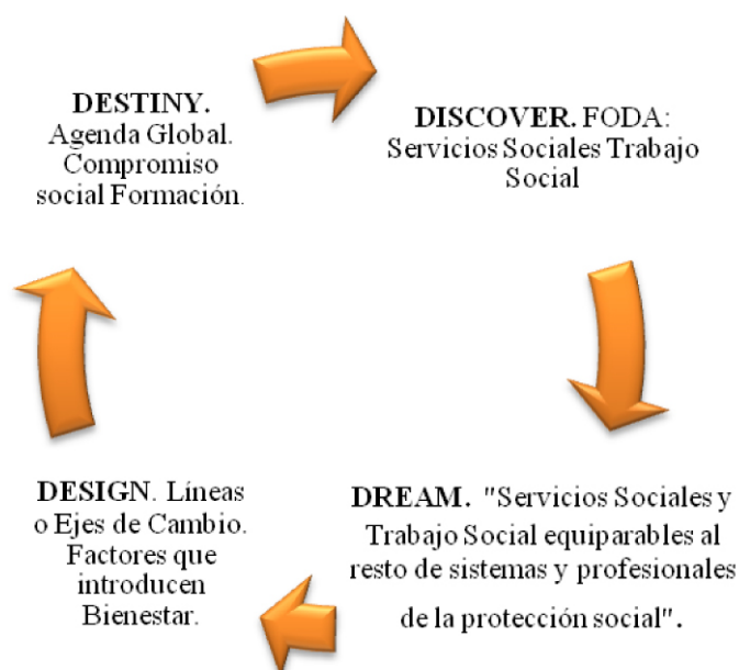
Gráfico 4: Ciclo 4D del Enfoque Appreciativo aplicado al Trabajo Social y a los Servicios Sociales.

Una vez identificados los puntos fuertes de los Servicios Sociales y del Trabajo Sociales, hemos de clarificar cuáles son los factores que introducen Bienestar y Malestar en los mismos. Aplicamos el Enfoque Appreciativo y presentamos las siguientes propuestas de transformación :