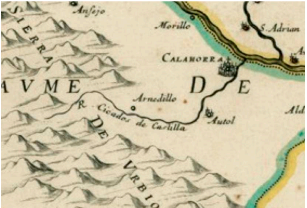
Figura 4. Fragmento del mapa de D'ABBEVILLE publicado en 1652 referente al Reino de Navarra. El mapa está orientado con el Norte hacia arriba como es habitual ya en todos los mapas. El río "Cicados de Castilla" muestra cerca de un Autol mal situado la desviación de casi 90° que le es característica. Sitúa a Arnedillo y también el "doble codo" aguas debajo de él.

conocimiento del curso del río Cidacos ya que está representado el "codo" de Autol, y aguas arriba se dibuja otra flexión de su trazado, pero no donde ni como debiera.