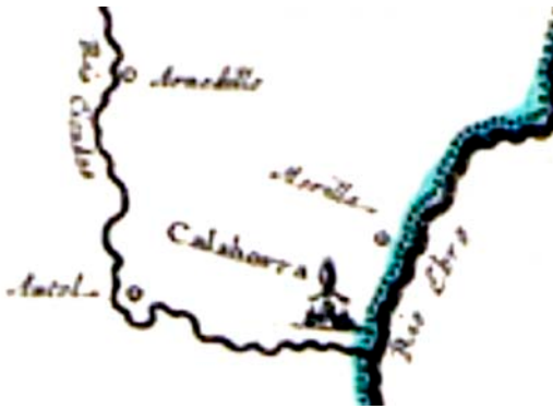
Figura 2. Porción del mapa de LABANHA publicado en 1633 en el que se representa el río Cidacos (en el mapa "Cicados"). El Norte está a la derecha. Calahorra está mitrada y "Autol" algo desplazado de su lugar; También están rotulados "Arnedillo" y "Murillo".

La particularidad sobresaliente de su trazado es que en él se ha dibujado la desviación que hace el río de casi 90° en las proximidades de Autol, es decir el "codo" de su curso existente en esa villa.