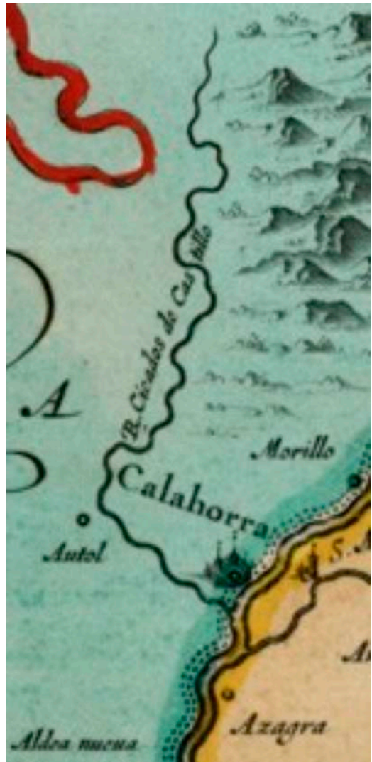
Figura 3. Ampliación del área del mapa de BLAEU de 1638 donde señala el río Cidacos, aquí llamado como "Cicados". Se nombran a las poblaciones de Autol y Calahorra en su valle, y en la figura están también indicadas las de "Aldea nueva", "Azagra" y "Morillo". El mapa está orientado con el Oeste hacia arriba.

En 1652 se publica en París el mapa que firma Sanson D'Abbeville (1600-1667) que fue ministro de estado en tiempos de Luis XIII 11 . El mapa está orientado como ya es habitual, es decir con el Norte hacia arriba y están localizadas las poblaciones de "Calahorra", "Autol" y "Arnedillo"; al río se le sigue denominando como "Cicados de Castilla". En este mapa se manifiesta un avance más en el