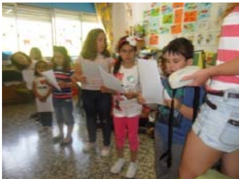
Imagen 7: Lectura biografía Miró

Una de las actividades que, sin duda, se presentaban más atrayentes para nuestro alumnado era la programación de una serie de visitas a diferentes Centros de Educación Infantil de Málaga que destacaban, fundamentalmente, por la puesta en práctica de Proyectos Educativos Innovadores. El primero de ellos fue el CEIP “Virgen de Belén”, el cual se encontraba en ese momento desarrollando un Proyecto de Trabajo sobre el pintor Miró con los niños y niñas de 5 años. Para nuestra sorpresa, fueron ellos mismos quienes nos dieron la bienvenida, leyeron la biografía de Miró y nos enseñaron algunas de las actividades realizadas en el aula.