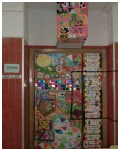
Imagen 11: Proyecto Puertas Regaladas

El último centro que tuvimos la oportunidad de visitar fue el CEIP “Revello de Toro”, una institución de enseñanza bilingüe con una interesante metodología de trabajo por proyectos en Educación Infantil.