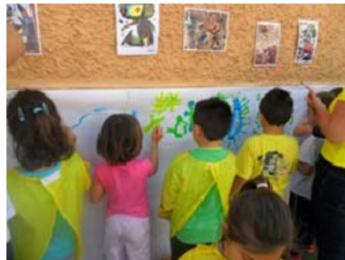
Imagen 8: Taller somos artistas como Miró