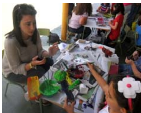
Imagen 9: Taller de esculturas

El siguiente centro visitado fue el CEIP “Nuestra Señora de Gracia”, un colegio premiado por el MEC en el área de Atención Compensatoria que se caracteriza por contar con una comunidad educativa organizada mediante asambleas, una