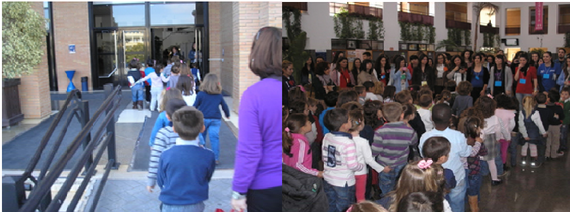
Imagen 5: Llegada del alumnado de infantil

Por otra parte, se aceptó, a su vez, que la Jornada diera inicio con una actividad común de bienvenida; y terminara, igualmente, con una actividad común que sirviera de despedida o cierre.