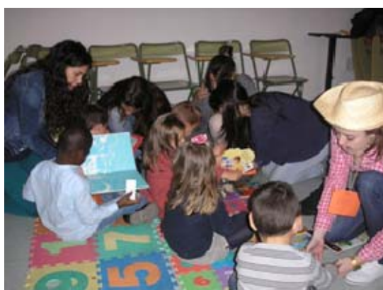
Imagen 3: Taller Cuentos