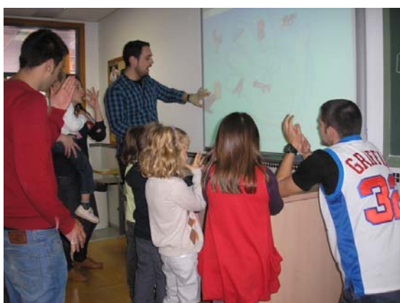
Imagen 1: Taller Pizarra Digital

Por un lado, la organización de una serie de Talleres (Pizarra Digital, Maquillaje, Globoflexia, Cantajuegos, Dibujo Creativo, Lectura de Cuentos Infantiles y Profesiones) por los que los niños y niñas irían pasando a lo largo de toda la mañana y que se desarrollarían de manera paralela a la visita guiada.