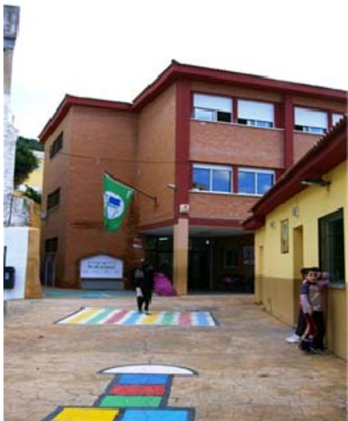
Imagen 10: CEIP Ntra.Sra. de Gracia (Málaga)

organización escolar versátil y un profesorado muy comprometido por dar respuesta a la atención a la diversidad.