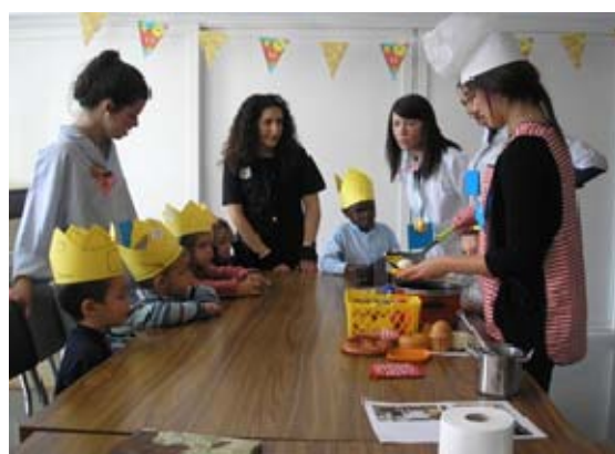
Imagen 4: Taller Profesiones