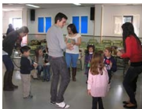
Imagen 2: Taller Cantajuegos