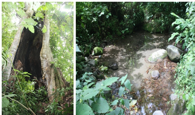
Figura 7. Árbol de álamo (izquierda) y manantial de agua cristalina (derecha).

Hay un pequeño manantial de agua cristalina (Figura 7), uva mexicana y Croton sp. Sobre un árbol de marangola hay las orquídeas Coelia macrostachya , Isochilus major y Dichaea péndula y sobre un árbol de guayabo Comparethia falcata .