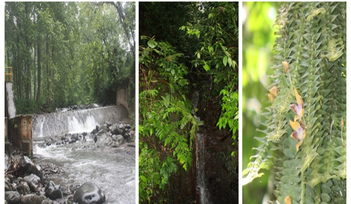
Figura 9. Represa (izquierda), cascada (centro) y orquídea Dichaea pendula (derecha).

scenery and riverside mountain. This site is conditioned for eating. The trail continues along the canal from the dam. We can observe wild chayote, begonias, maroon gladiolas ( Crocoshmia crocosmiflora ) and ferns. Orchids Gongora galeata , Chysis aurea , Isochilus majoz , Leochilus carinatus and Stelis sp. are also around. There are also crops of coffee, maize, beans and tobacco chilli pepper. Abundant pastures for livestock. Crossing the canal we can see orchids Dichaea pendula (Figure 9), Chysis aurea , Epidendrum paniculatum , Stanhopea oculata and a pipicho tree. There are bell-flowers, ferns ( Nephelea mexicana (Schltdl. & Cham.) R. M. Tryon), heliconia and tepexilote palms ( Chamedor tepexilote L.) and parlor ( Chamaedora elegans L.). As an additional attraction, there is a beautiful waterfall that comes from the fog-forest of the Poxtla ejido (Figure 9).