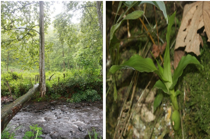
Figura 5. Puente de Carrizal (izquierda) y orquídea Coelia macrostachya (derecha).

Figure 5. Carrizal Bridge (left) and orchid Coelia macrostachya (right).