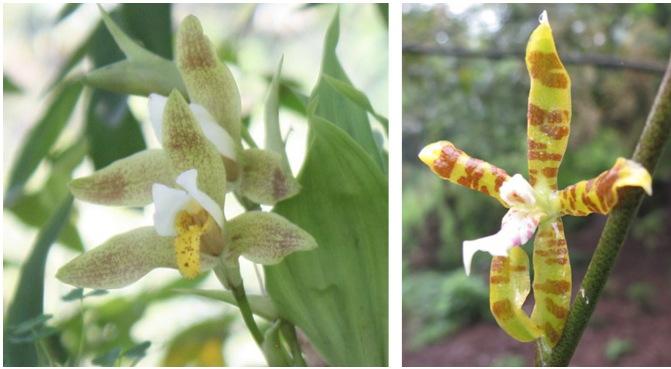
Figura 3. Orquídeas en floración: Lycaste deppei (izquierda) y Oncidium stenoglossum (derecha).