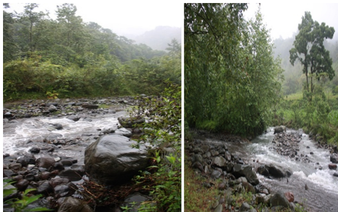
Figura 8. Zona de chapoteaderos (izquierda) y cruce de los ríos Metlac y Texalapa (derecha).

Located 600 m from the previous point and there is a stream of clear water, where we can splash about (Figure 8). There are abundant populations of Heliconia sp., poplar trees, ferns, horsetail, "tlanepa", "bad woman" ( Wigandia urens ). The trail continues along the river, surrounded by walnut trees ( Juglans regia L.) and the treetops there are bromeliads ( Tillandsia lucida ) and orchids Isochilus major and Leochilus carinatus .