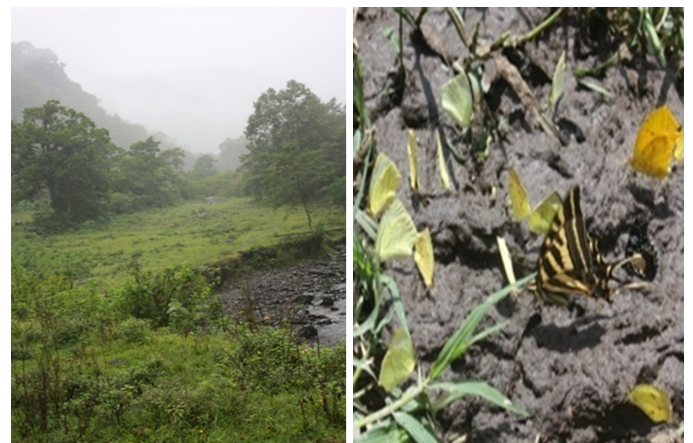
Figura 6. Campo abierto (izquierda) y mariposas (derecha).

The site is 800 m from point 3 (Table 1). The soil is clay and we can see the yellow orchid guava ( Leochilus carinatus ). Along the way there are several poplar trees, an open field suitable for camping (Figure 6) and maize crops. It is crossed by a small stream of clear water and on the side of the river we can see the orchid Epidendrum paniculatum , Gongora galeata , Dichaea pendula and several populations of Leochilus carinatus . An exotic local plant, similar to the torch, ocher hue and arborescent ferns ( Nephelea mexicana ). Crossing the little Valiente river and we can see a cempasúchitl cultivation ( Tagetes erecta ). It is quite common to find butterflies ( Heraclides thoas autocles , Phoebis neocypris virgo , Phoebis sennae marcellina , Morpho helenor montezuma ) (Figure 6). In the trees we can find and listen to the song of the birds Myiozetetes similis and Tyrannus couchii .