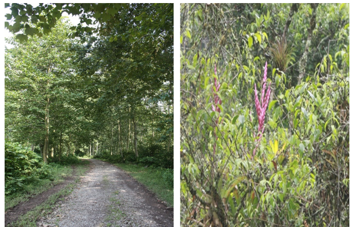
Figura 4. Camino del punto 2 (izquierda) y bromelia Tillandsia lucida (derecha).

This point is located in the first 400 m (Table 1). The orchids that can be observed are Epidendrum conopseum , Campylocentrum schiedeii , Oncidium cavendishianum , Leochilus carinatus , Dichaea pendulous , and Epidendrum melistagum , Brassia verrucosa . There are also two very striking bromeliads, pink ( Tillandsia lucida ) (Figure 4, right) and purple ( Tillandsia aeranthos ) at flowering stage during May. Orchids can be found in alder trees ( Alnus acuminata Kunth), walnut ( Juglans regia L.), cherimoya ( Annona cherimola ) and hawthorn ( Crataegus spp.). In the tree-tops we can see the boat-billed flycatcher bird ( Megarynchus pitangua ) as well.