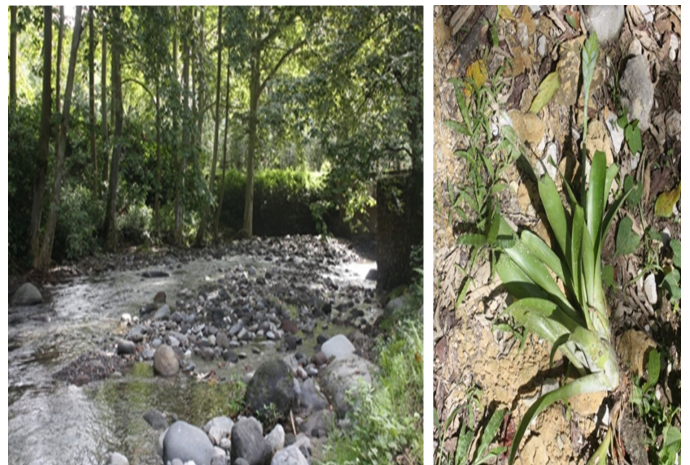
Figura 10. Puente San Martín (izquierda) y bromelia Tillandsia nitida (derecha).