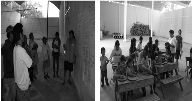
Figura 2. Talleres participativos y de capacitación. Figure 2. Participatory and training workshops.

de 15 años y 5 hombres mayores de 20 años. La asistencia de las personas fue muy variada: el 40% de participantes asistió de forma constante, entre ellos, mujeres jóvenes de entre 16 y 40 años, niñas de 7 a 14 y un hombre de 23 años.