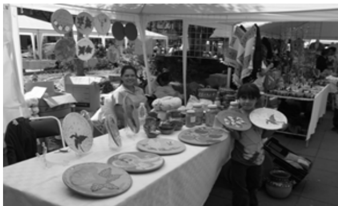
Figura 3. Stand de productos de Cuapexco y exhibición comales decorados.

Las valoraciones de los consumidores expresadas en dinero sobre lo que pueden o están dispuestos a pagar por un producto se relacionan sin duda a su ingreso, lo que les gusta, por el género al que pertenece (Cuadro 3), y algunas otras características. En el análisis por ocupación, se observó que ser ama de casa o tener alguna otra actividad como empleado o comerciante no determina una tendencia de lo que se puede pagar por los comales decorados.