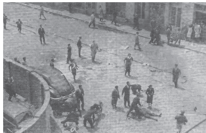
Figura 1. Nueve de junio de 1954. Calle 13 con carrera séptima. Masacre estudiantil en la administración de Rojas Pinilla