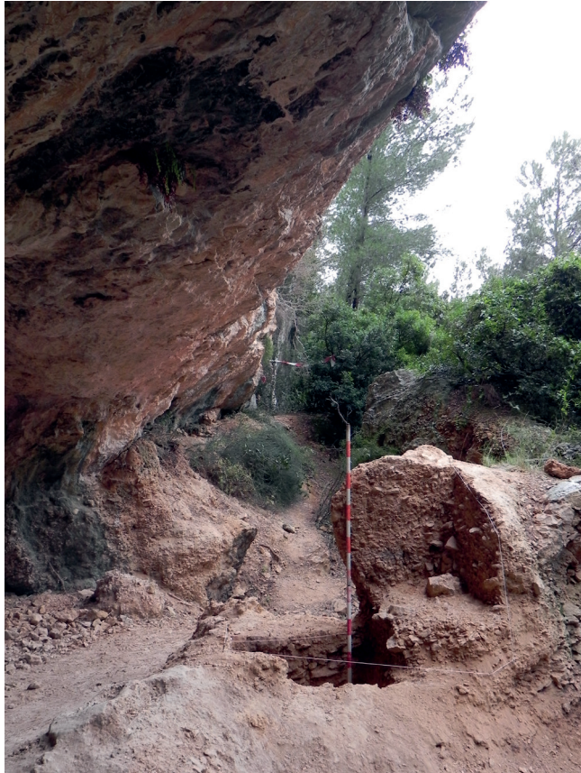
Figura 1. Vista del depósito arqueológico de la Cova de la Barriada (Benidorm).

el apartado económico destaca la importancia de los aportes de conejo y una mayor presencia de ungulados de cierto tamaño en los niveles más antiguos y un mayor dominio de ciervo y cabra en los superiores. Los datos disponibles a nivel regional permiten vincular los inicios del arte a esta etapa industrial (Villaverde et al. , 2007-2008).