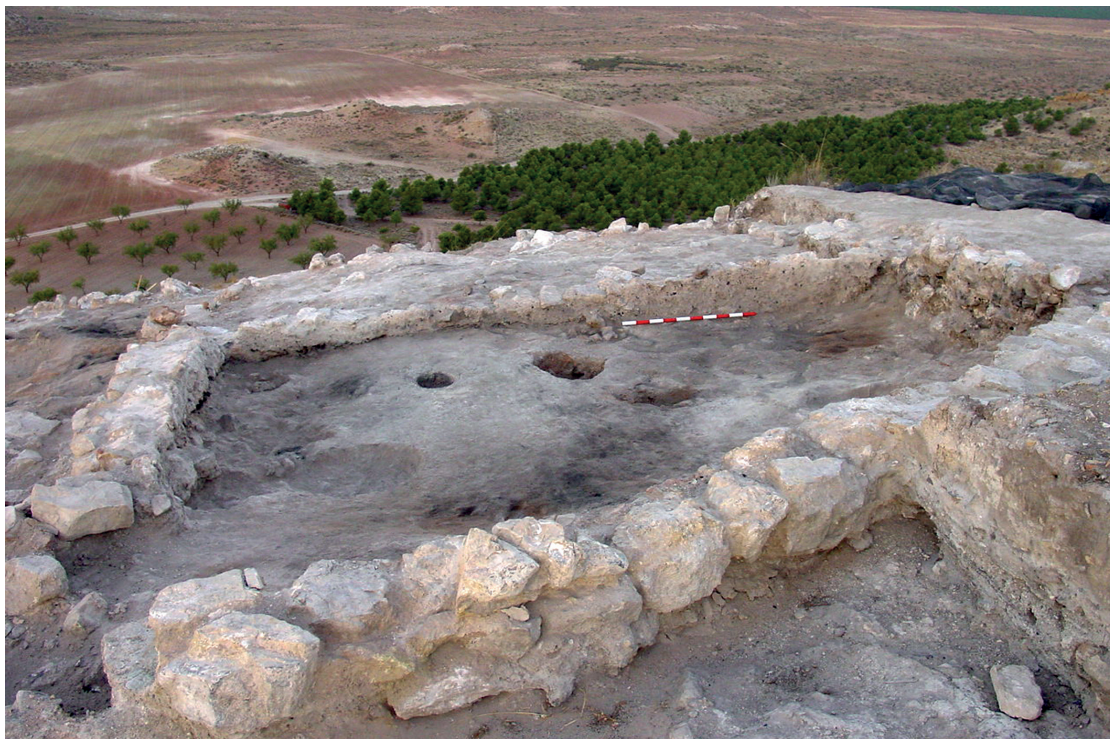
Figura 5. Zócalos y pavimento de una unidad habitacional de Terlinques (Villena).

realizados durante estos últimos años han permitido en parte cumplir ambos objetivos. La estratigrafía prehistórica, muy afectada por construcciones de época altomedieval, muestra tres fases de ocupación del poblado. De la primera, datada hacia inicios del II milenio, se han conservado restos de viviendas de tamaño bastante grande, con paredes con zócalos de mampostería y alzados y techumbres de barro, que fueron destruidas de forma violenta por un incendio que podemos fechar en torno a 1800 cal BC.