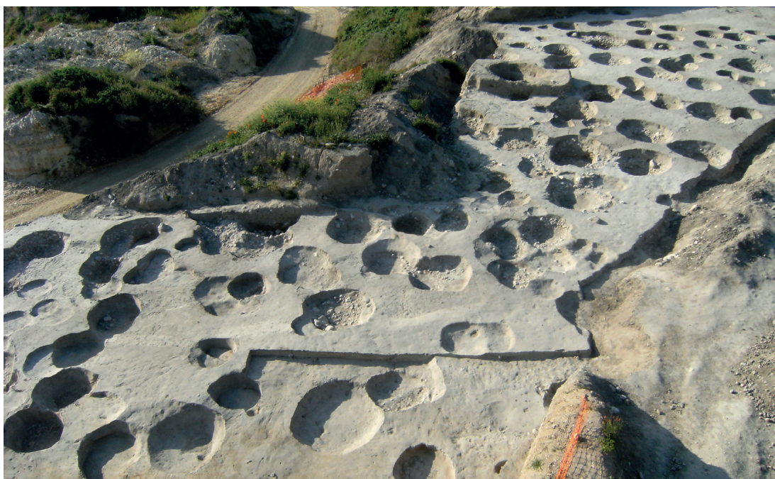
Figura 2. Silos y estructuras negativas excavadas en el yacimiento de Benámer (Muro de l'Alcoi, Alicante).