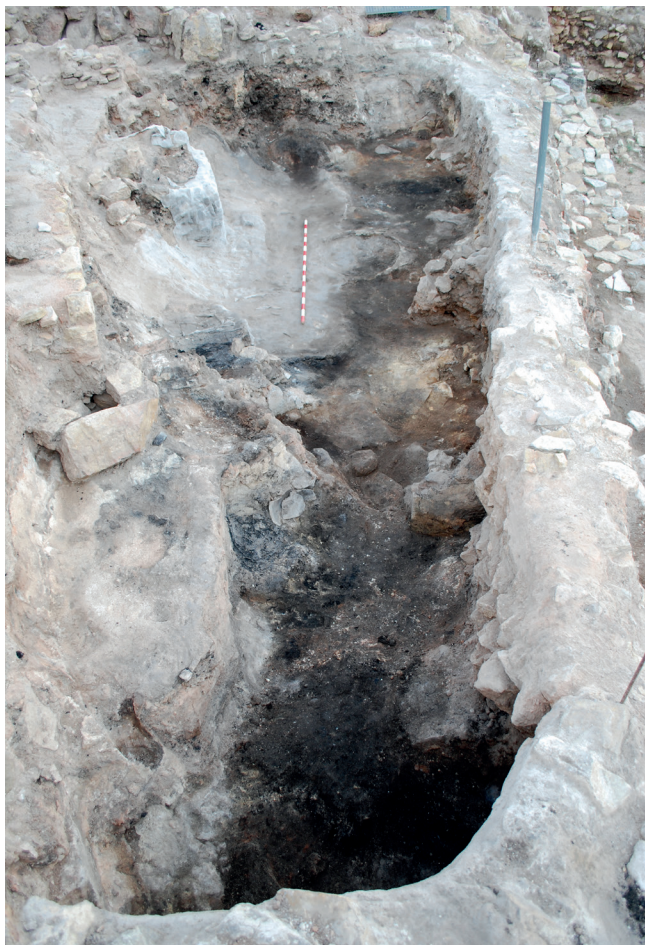
Figura 6. Vista del Departamento XXVII de Cabezo Redondo, desde el norte.

va a permitir evaluar la sintonía cronológica de éstos y, por tanto, establecer relaciones entre unos y otros en el marco del desarrollo del proceso histórico que los involucró: una vieja aspiración que se remonta a los tiempos de Miquel Tarradell (Jover y López, 2009 a).