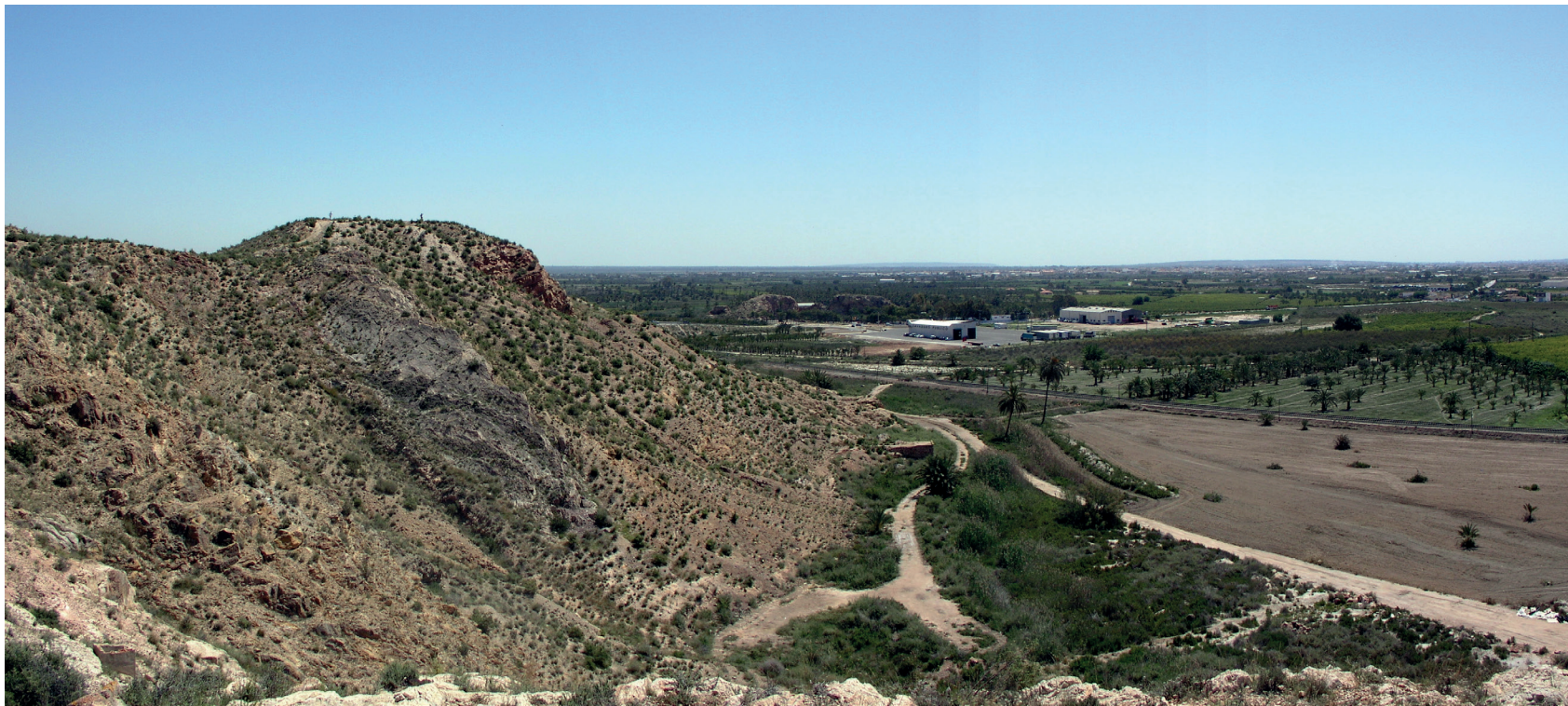
Figura 4. El Cabezo Pardo (San Isidro) desde el sudoeste. Al fondo, la planicie de la antigua albufera de la desembocadura del Segura y a lo lejos la Sierra de El Molar (San Fulgencio).

resultaría imposible en el marco de la ponencia que aquí nos ocupa, y nos permite centrarnos sólo en algunos de los aspectos que se han juzgado más relevantes.