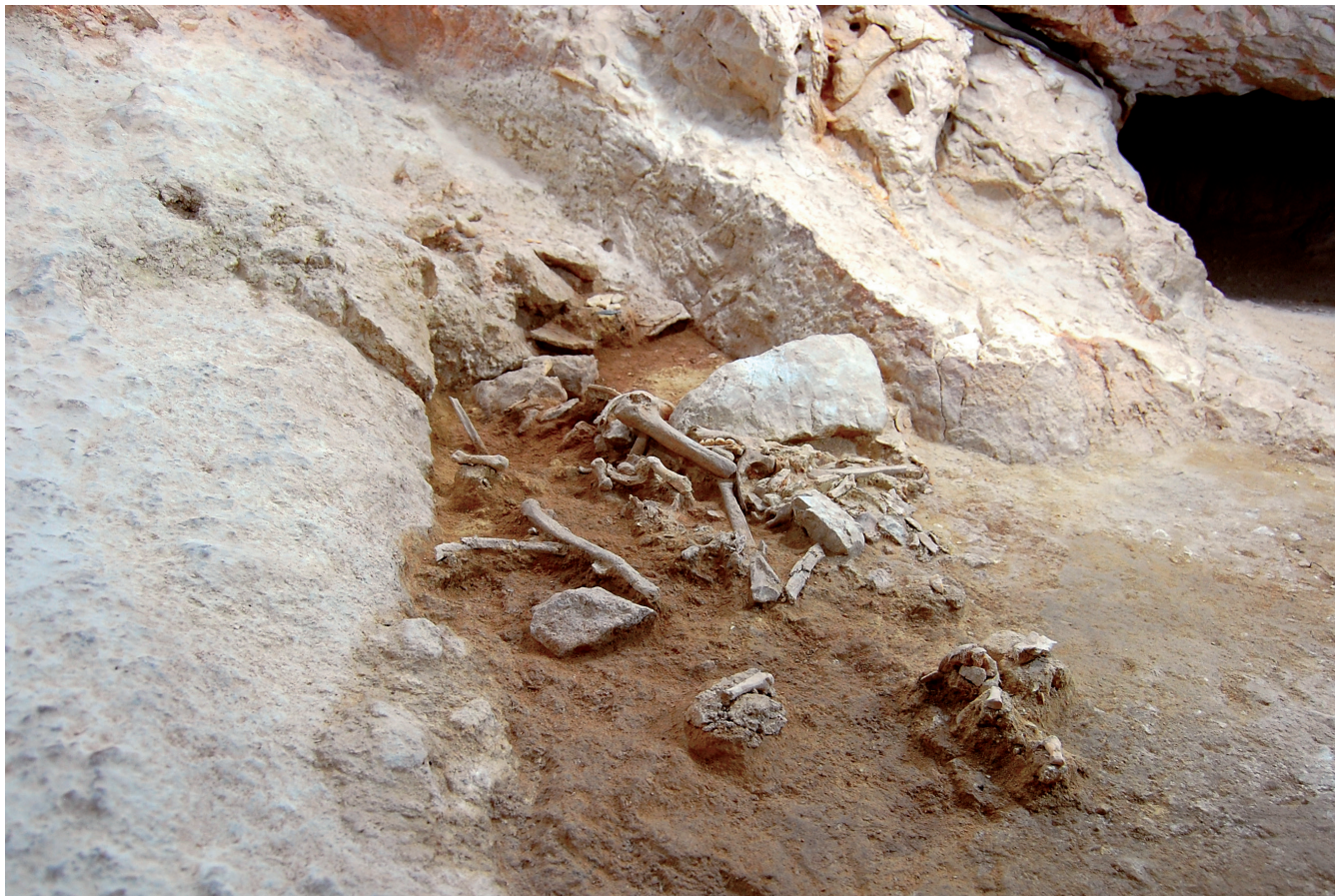
Figura 3. Restos óseos humanos localizados en el interior de la Cova del Mig Día (Pedreguer).

hoy ofrece las dataciones más antiguas de nuestro Neolítico -5550 / 5580 a.n.e. (Soler et al. , 2012), obtenidas a partir de muestras de cabra doméstica y también salvaje, ésta quizá abatida por aquellos pioneros que, alejados de sus territorios de origen, no renuncian a la caza y recolección como prácticas que, en sus primeras pesquisas en el territorio, ofrecen menor riesgo que las propias de la economía agropecuaria, que de manera inmediata caracterizará al cardial clásico en la segunda mitad del VI milenio a.C. Es con todo el inicio del proceso histórico que, en una última síntesis editada por el Museo de Prehistoria de Valencia y a propósito del hábitat de Benàmer de Muro, recién se nos presenta considerando un panorama de colonización desde el territorio primigenio, no exento de conflictividad con los ocupantes epipaleolíticos (Jover y Torregrosa, 2012: 7).