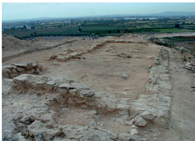
Figura 4. Vista de uno de los edificios del conjunto localizado en el Sector 4, correspondiente a la ocupación de época emiral (s. VIII-IX d.C.)