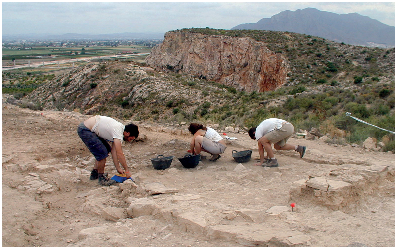
Figura 3. Trabajos arqueológicos en el Sector 4

La única fecha disponible para esta fase proviene del pavimento del edificio U, obtenida a partir de un hueso de bóvido, que apenas permite proponer un marco cronológico para esta fase de en torno a 1600- 1550/1500 cal ANE.