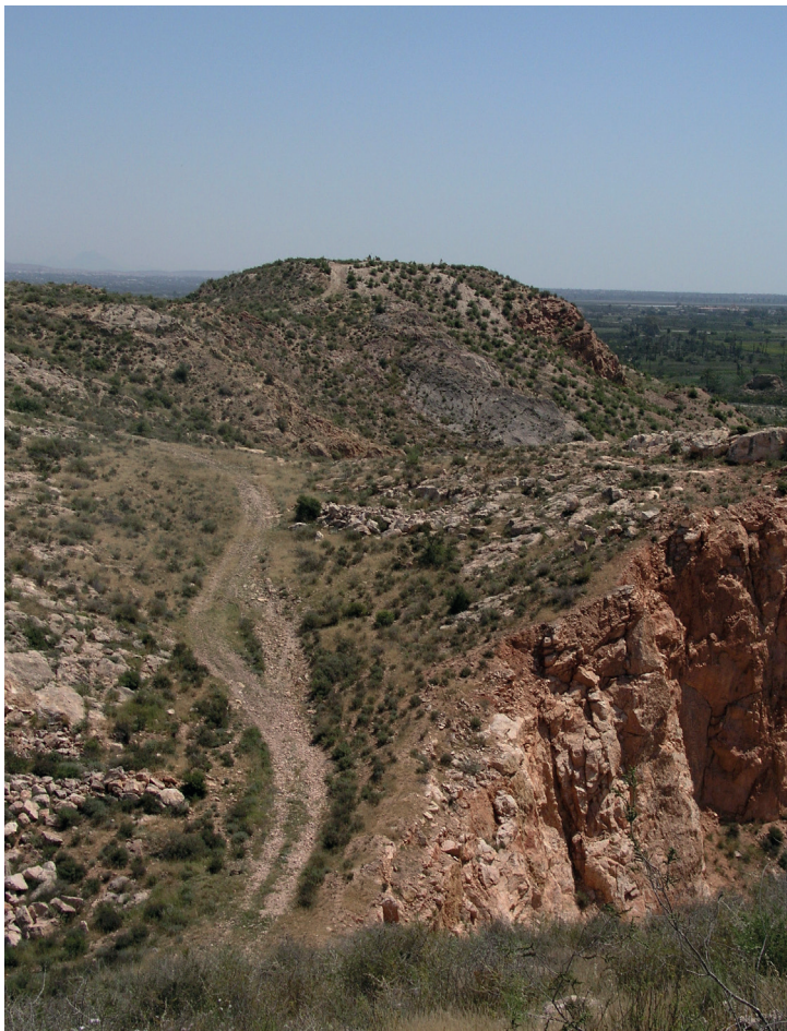
Figura 1. Vista del Cabezo Pardo (San Isidro/Granja de Rocamora, Alicante) desde el Suroeste.

época emiral, superpuesto a los paquetes estratigráficos del asentamiento argárico (López y Ximénez, 2008). Esta superposición, no obstante, sólo se ha registrado en el área abierta en el propio Cabezo Pardo, pues la alquería medieval posterior extendió su hábitat prácticamente por todas las cimas de los Cabezos.