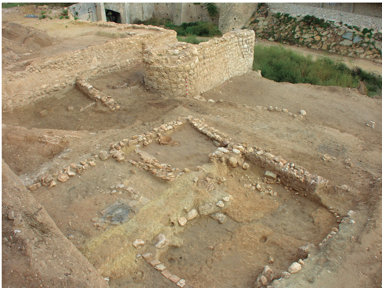
Figura 4. Vista general de la fortificación y el asentamiento anexo.

continuar bajo el perfil de seguridad. Es un espacio doméstico subdividido en tres estancias; en la situada en el lado noroeste de la vivienda se ha encontrado un hogar sobre una base de ladrillos cuadrangular apoyado en un tabique de ladrillos por su lado sur. Esta estancia continuaría por debajo del perfil de seguridad. Al sureste de ésta se localiza una segunda estancia cuadrangular, ambas están comunicadas entre sí por un umbral formado por dos bloques de piedra. En esta segunda habitación se ha documentado in situ un gran barreño con aliviadero en la parte baja. Por último, la tercera habitación que se encuentra al suroeste de las dos anteriores, presenta una planta rectangular cuya longitud sería la suma de las otras dos estancias. Como estructuras internas hay que destacar la presencia de una pilastra adosada a su muro más occidental y de un tabique de ladrillos que la subdivide en su tercio noroeste. Al igual que la primera habitación, ésta se desarrolla por debajo del perfil de seguridad (Fig. 4).