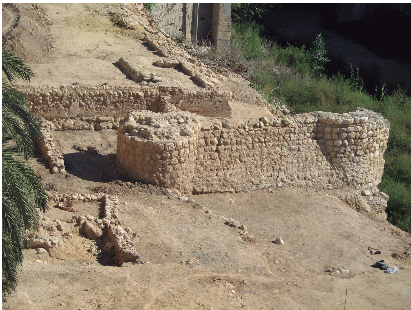
Figura 3. Vista de la fortificación.

y tomados con mortero de cal, en cuyas juntas se observa la incrustación de pequeñas piedras a modo de recalce. Aunque se conserva sólo parcialmente, el segmento que se mantiene es de una espectacularidad manifiesta, conservando un alzado de unos 3 metros, sin contar la cimentación y casi doce metros y medio de longitud. Otra de las características esenciales es que el tramo inferior del lienzo de muralla presenta un alambor o zarpa en plano inclinado con el fin de reforzarla.