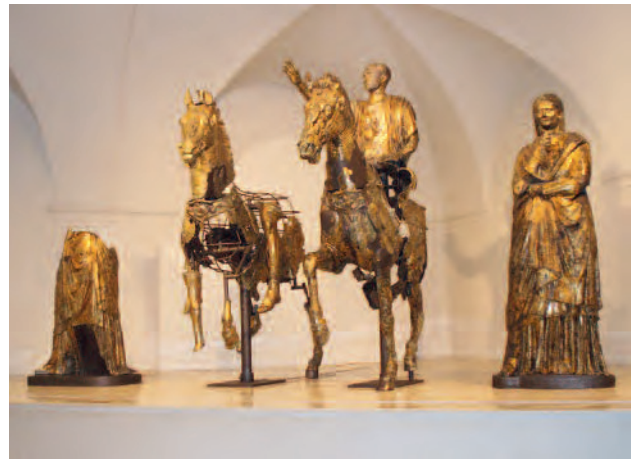
(Figura 4) Grupo ecuestre de Pergola , 50-30 a. C. Bronce dorado. Tamaño casi natural. Detalle en el que se aprecian las figuras que mejor se han conservado. Destaca el jinete que saluda y la dama velada.