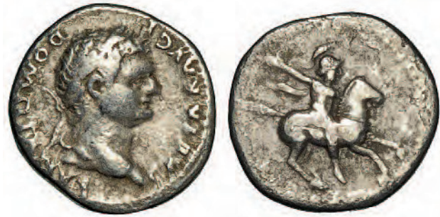
(Figura 12) : Denario de Domiciano con su representación ecuestre en el reverso.

Imágenes de caza pueden ser asociadas a la virtus imperial y es utilizado por el emperador Adriano en los Tondi Adrianei y medallones asociados, consideradas las imágenes más tempranas de un emperador como