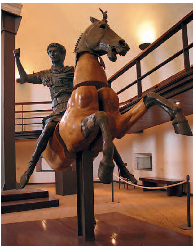
(Figura 11) Escultura ecuestre en bronce de Domiciano, reconvertida en la estatua de Nerva, encontrada en 1968 en el Santuario de los Augustales de Miseno. 97 d. C. Museo Archeologico dei Campi Flegrei, Baie.

La estatua ecuestre de Domiciano ( Equus Domitiani ) era un monumento honorario del Foro Romano, erigido en el año 91 para conmemorar la victoria del emperador contra los germanos y colocado al centro de la plaza donde hoy solo queda un hoyo de forma rectangular donde estaba colocado el basamento. En el lugar se puede observar tres bloques de travertino que formaban parte del monumento y se presume que alcanzaba los 8 metros (12 ó 13 con el basamento). Casi con seguridad fue demolida después del asesinato del emperador en el año 96 17 .