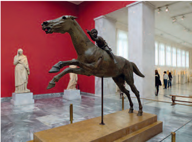
(Figura 1) "Jinete de Artemision" hallada en 1928 y 1937 en varios fragmentos en el fondo del mar, frente a las costas del Cabo Artemision, Eubea, Museo Arqueológico Nacional de Atenas.

como confirman las fuentes escritas y los testimonios iconográficos que nos proporciona la numismática. Todas ellas fueron precedentes y sirvieron de ejemplo a la tan famosa y conocida de Marco Aurelio en el siglo II.