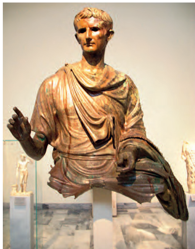
(Figura 6) Cuerpo de bronce de estatua ecuestre atribuida a Augusto. Museo Nacional de Atenas (Nº. Inv. X 23322).

Un importante paralelo (o quizá antecedente) es el torso de una escultura ecuestre que actualmente se