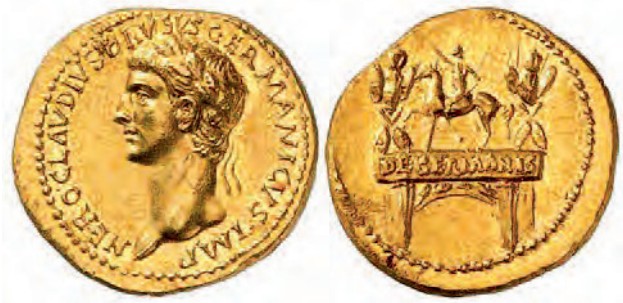
(Figura 10) Esta estatuaria sobre arquitectura continuó con los sucesores de Augusto: Aureo de Claudio con la leyenda Nero Claudius Drusus Germanicus Imp. (Roma 41-42 d.C. RIC 71.) Acuñado en una ceca itálica, probablemente, Roma. (7,64 g). Anverso: Efigie de Claudio diademado a la derecha. Reverso: Estatua ecuestre de Claudio hacia la izquierda, saludando, extiende su mano derecha. Sobre un arco triunfal, entre dos trofeos. Leyenda del Arco: D.L. GERMANIS.

Entre estas excepciones destacan unos magníficos platos circulares bronceos sin duda de carácter conmemorativo, con la leyenda: IMP NERO CAESAR AVG P MAX TR POT PP, / D [ECVRSI] O S.C. NERO/, que se han identificado como espejos, cuya decoración, muy posiblemente tomando como modelo emisiones monetarias, se divide en dos tipos: El primero (I) con la efigie de Nerón, mirando hacia la derecha la cabeza laureada y otra segunda representación (II) Nerón como jinete hacia la derecha, sosteniendo una lanza; detrás de él, un soldado a caballo, ( vexillum ) 14 .