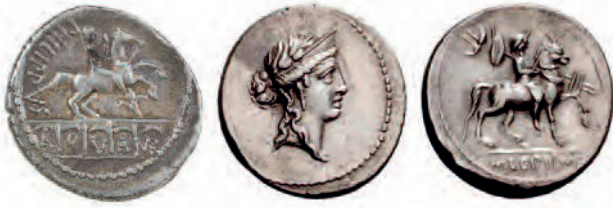
(Figura 3) Denario . Emitido en el 56 a.C. en cuyo reverso: su estatua ecuestre sobre acueducto, Leyenda: AQVA MAR, entre los arcos, PHILLIVS. Denario . Emitido en el 58 a.C Anverso: cabeza femenina diademada mirando a la izquierda, puede ser interpretada como la Concordia. Reverso: Estatua ecuestre de M Aemilius portando un trofeo que apoya sobre el hombro Leyenda: M. LEPIDVS, in exergo. Leyenda: AN. XV. PR. H. O. C. S (. Cr419/1d, Syd 830b).

nería, como los acueductos que beneficiaban al pueblo de Roma.