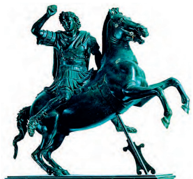
(Figura 2) Estatua ecuestre de Alejandro Magno procedente de Herculano. Hallada el 22 de octubre de 1761 cerca del Teatro en la excavación realizada por Carlos VII de Borbón. Siglo I a.C. - siglo I d.C. Bronce con pequeños ornamentos de plata; 48,5 cm de altura, 47 cm de anchura. Nápoles, Museo Arqueológico Nacional de Nápoles, Nº de Inv. 4996.

Algunas emisiones monetarias republicanas muestran estatuas ecuestres vinculadas no con victorias y acontecimientos militares sino conmemorando otro tipo de eventos: realización de grandes construcciones arquitectónicas como los arcos de triunfo, cuya tradición se mantuvo a lo largo del Imperio, y grandes obras de de inge-