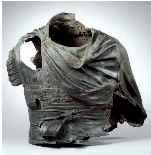
(Figura 7) Torso de una escultura ecuestre. Metropolitan Museum. Nueva York. (Número de Inventario: 2003.407.7).

En el año 2004 se habían sacado a la luz 24 hábitats y un pozo de 4 m de profundidad. Ningún templo ha sido