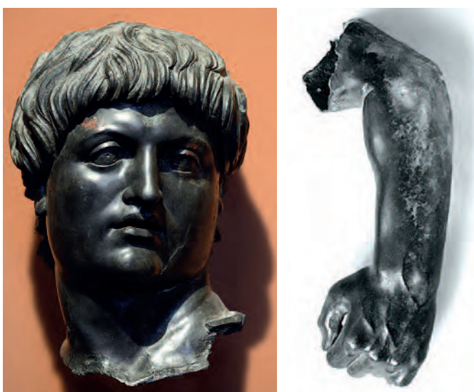
(Figura 9) Posible Cabeza y cuello de una escultura ecuestre de bronce procedente de Cilicia (Turquía), actualmente en el Museo De Louvre (París).

Precisamente la disposición particular del flequillo ligeramente ondulado favorece la hipótesis de que se trata de un príncipe de la familia Julio-Claudia [10], incluso tiene bastantes semejanzas con el retrato neroniano representado en las emisiones monetarias de su primera etapa, aunque en las acuñaciones de la reforma monetaria del año 64, no luce ya este estilo de peinado, sino una melena más larga que cae sobre su cuello. Un estudio paralelo de esta escultura con otros retratos de este príncipe Julio-Claudio, analizando su rostro permitiría establecer su