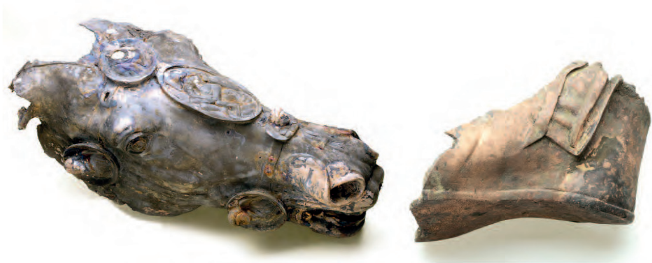
(Figura 8) Hallazgos del yacimiento de Lahnau-Waldgirmes que posiblemente pertenezcan a una escultura ecuestre en bronce dorado: A: Cabeza de un caballo. B: Calzado de pie de tamaño natural.

ológico, se encuentran sometidos a análisis arqueometalúrgicos.