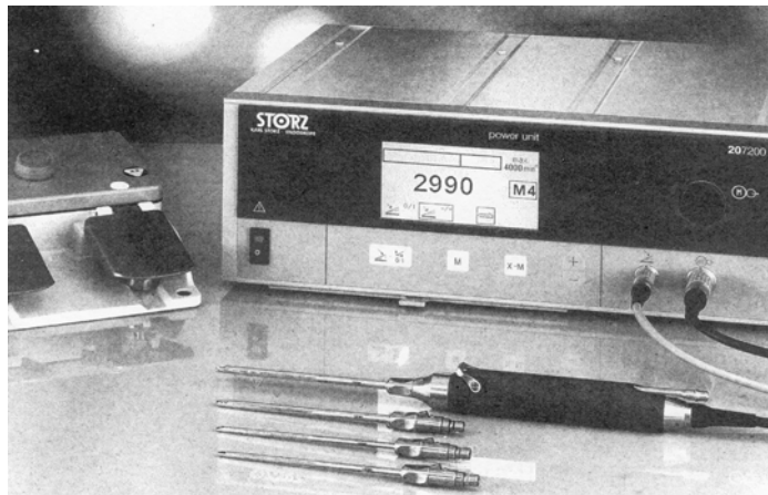
Instrumento motorizado para la realización de cortes, fresado y afeitado de la superficie articular por artroscopia.

Nosotros hemos observado que el factor edad no constituye un elemento que define un mal pronóstico basados en los resultados hallados en nuestro estudio. De igual modo la evolución general no ha estado paralelamente en función de dicho factor edad y pacientes ancianos y menos ancianos, han tenido una pronta recuperación e incorporación a la vida diaria. Otros factores consideramos han sido más influyentes en ese sentido. La obesidad ha constituido un factor de mal pronóstico evolutivo de manera que ha influido en dilaciones en la recuperación de la articulación