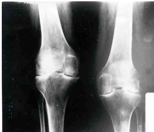
Rayos X simple de rodillas (vista AP) . Se observa un marcado estrechamiento del espacio articular bicompartimental por cambios degenerativos avanzados. Esta fase radiológica constituye una contraindicación relativa para el abordaje terapéutico por artroscopía.

causales del dolor y la sintomatología de los pacientes. La condromalacia de rótula relacionada o no con la Plica Sinovial medio patelar causando Impingment ha sido la afección más frecuente constatada En esta patología nuestras acciones estuvieron dirigidas hacia su excéresis y debridamiento condral fundamentalmente en el orden terapéutico. ¿Donde se halla la frontera entre la Condromalacia patelofemoral y Artrosis precisamente fue la interrogante que se planteó y analizó Checa González en uno de sus trabajos (30) Concordamos con sus interesantes criterios pues más allá de tratarse de un elemento clínico, debe evaluarse como un fenómeno anatómopatológico descriptivo de un daño articular del cartílago en el cual la fibrilación el reblandecimiento y fisuración del cartílago difícil de separar del proceso degenerativo en sí mismo y conducente a la exposición del