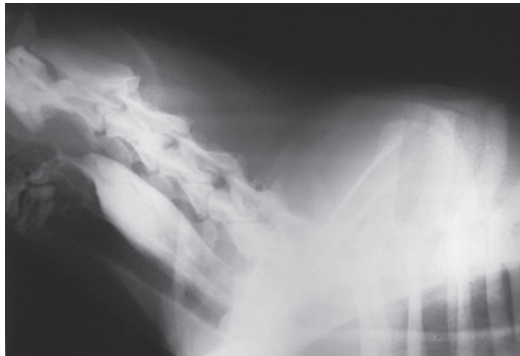
Figura 2. Radiografía latero-lateral de cuello con medio de contraste. Se observa retención de bario y reflujo del mismo hacia la laringe y la faringe, en el caso 2.

Debido a complicaciones del proceso neumónico y a que se trataba de un animal callejero, sin un propietario que se hiciera cargo de los costos de su tratamiento, se realizó eutanasia con pentobarbital (Euthanex®, laboratorio Intervet).