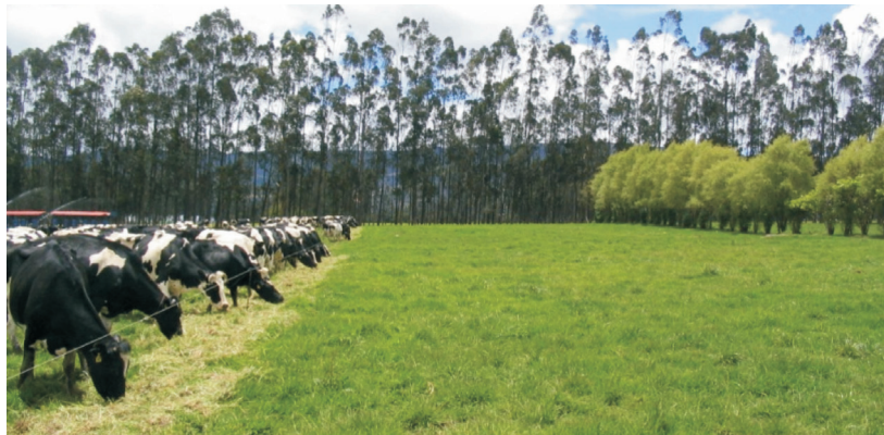
Figura 2. Microclima generado por sistemas silvopastoriles y su efecto en el incremento del consumo voluntario. Sabana de Bogotá, Colombia.

Navas (2003) encontró que la mayoría de los animales (65%), se concentra bajo la copa de los árboles en las horas del día de mayor temperatura para reducir el estrés calórico, mientras que en las horas más frescas de la mañana y tarde se ubican en áreas de potrero abierto (figura 3). Los microclimas que forman los