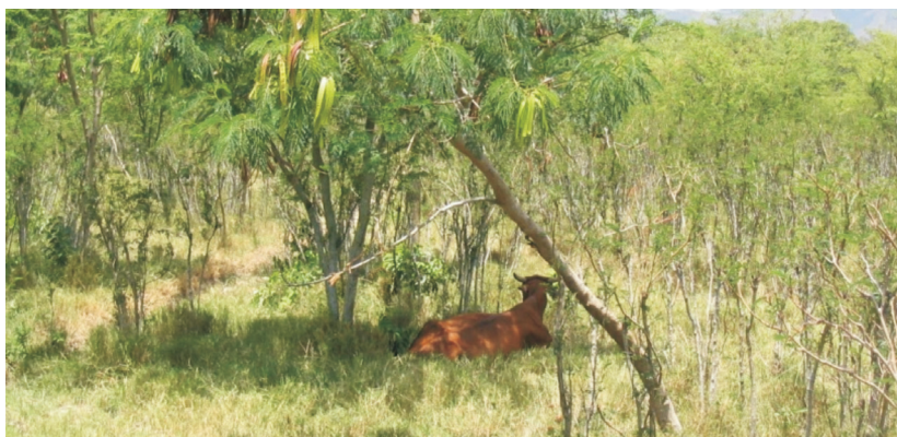
Figura 1. Incremento en los tiempos de rumia en horas de alta temperatura debido a la reducción del estrés calórico en sistemas silvopastoriles multiestrato. Hacienda El Chaco. Alvarado, Colombia

Los sistemas silvopastoriles, a través de la producción de sombra, reducen el estrés calórico, Pezo e Ibraim (1998) mencionan tienen efectos positivos sobre el consumo voluntario, la producción de carne