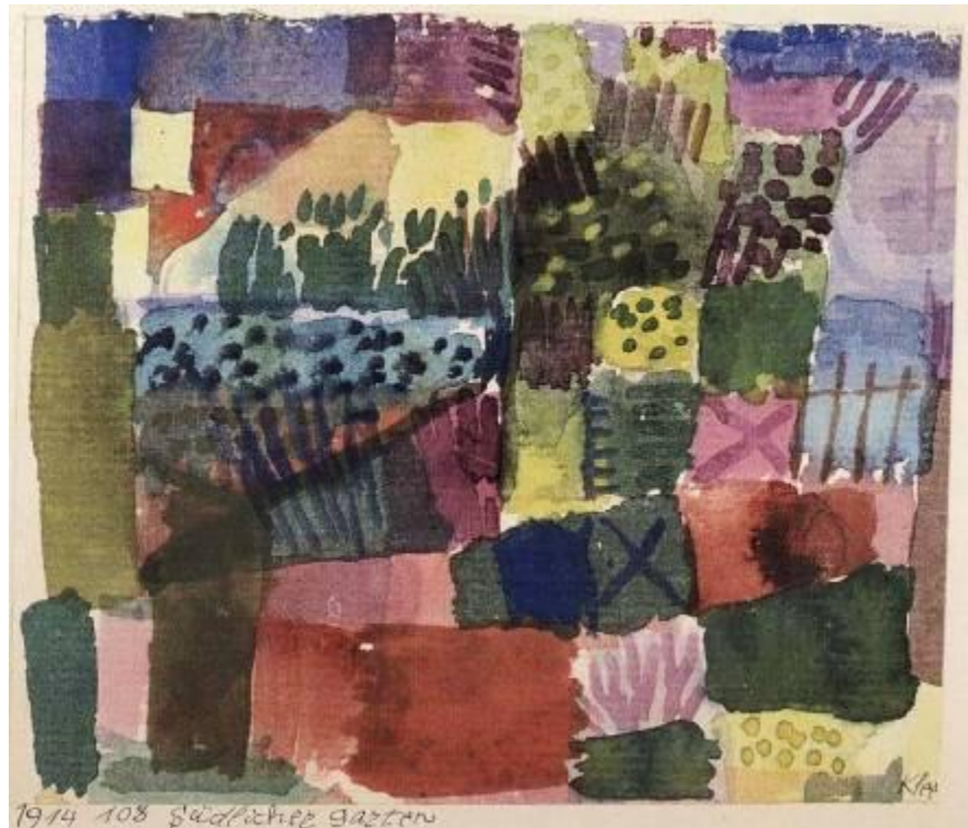
Figura 6. Paul Klee, 1914, Jardín mediterráneo , acuarela.

Estallido, epifanía y territorio existencial son también términos apropiados para describir el paisaje de María Luisa Bombal. En efecto, el paisaje de Klee guarda semejanzas con el de la escritora chilena, puesto que en ambos la perspectiva ha sido negada para modificar la mirada horizontal. En La última niebla , la perspectiva está anulada porque, tal como Goic lo expresa en Los mitos degradados (1997: 170), todo el mundo de la novela corresponde al mundo interior de la narradora quien ha renunciado a la omnisciencia y al dominio consciente del universo. La perspectiva desplazada, tal como Goic lo reconoce, se manifiesta en la ausencia de distancia espacial y temporal entre la narradora y el mundo narrado, proporcionando inmediatez y simultaneidad entre el hecho y la palabra.