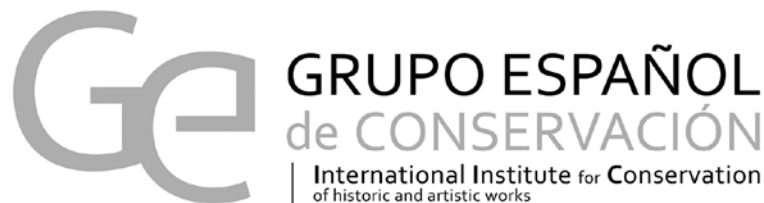
FIGURA 1. Logotipo de Ge-conservación (Cortesía: Ge-conservación , GEIIC).

En “reconocimiento a su amplia trayectoria como asociación y exponente de la participación de la sociedad civil en la conservación, investigación, formación y difusión del patrimonio cultural” (MECD 2014), en el 2011 GEIIC recibió el Premio Nacional de Conservación y Restauración de Bienes Culturales del MECD —primera vez que éste lo otorgó a una organización de carácter asociativo y profesional, en este caso, con una amplia proyección en la comunidad de conservadores y restauradores—, lo