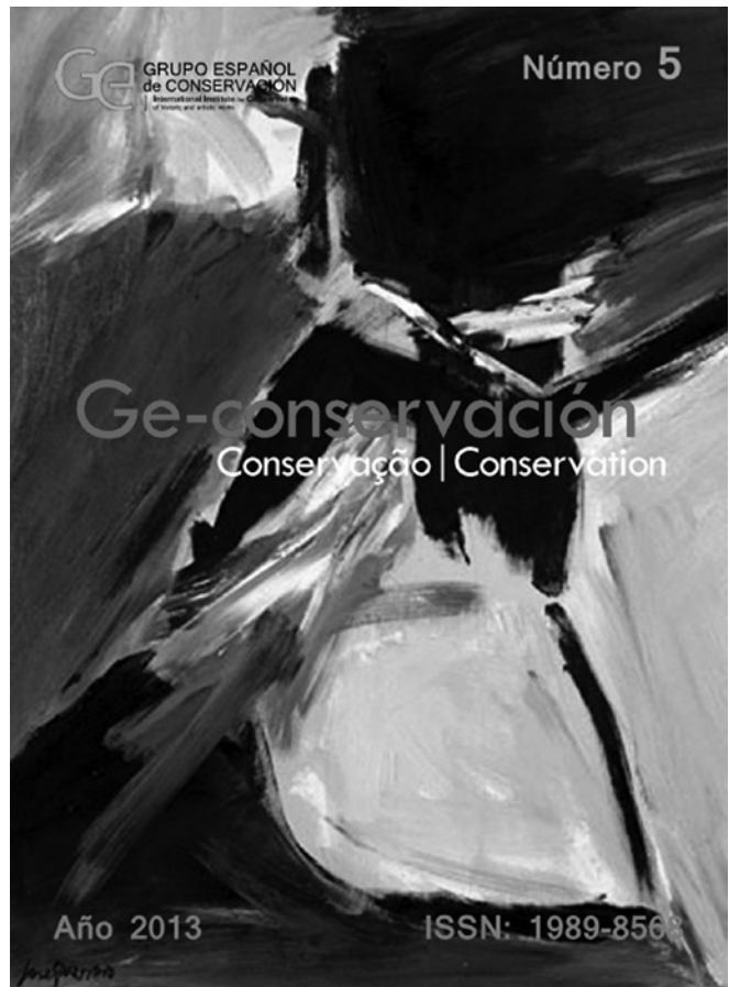
FIGURA 4. Portada del número 5 de Ge-conservación, 2013.