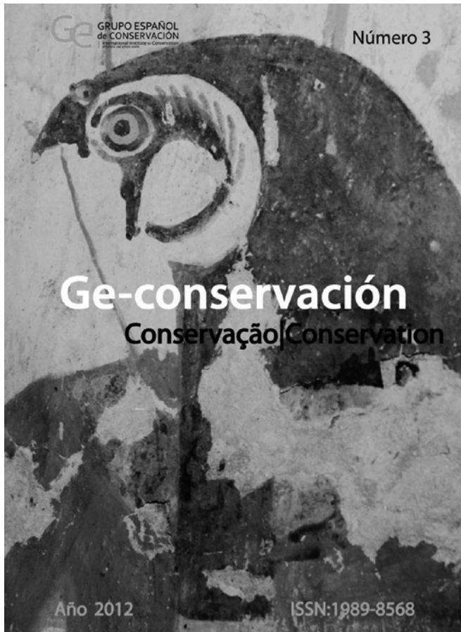
FIGURA 3. Portada del número 3 de Ge-conservación , 2012 (Cortesía: Ge-conservación , GEIIC).