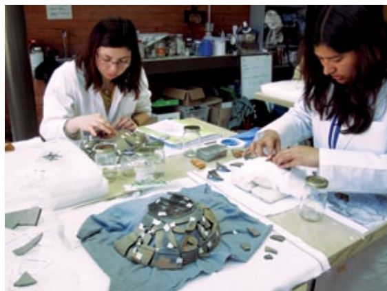
▲ FIGURA 4. Restauración de la colección de sahumeros, proceso de unión de fragmentos.