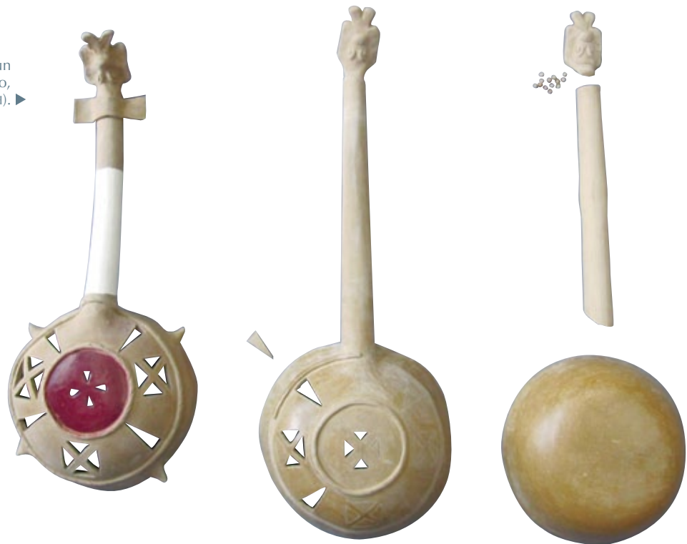
FIGURA 6. Etapas de manufactura de un sahumerio.

Cuando la arcilla se encontraba más seca, se aplicaba el engobe rojo de la base, el cual se bruñía cuidadosamente (Figura 9) para dar paso a la cocción de las piezas. Finalmente la decoración podía complementarse con policromía post-cocción.