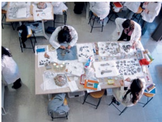
▲ FIGURA 3. Seminario-Taller de Restauración de Cerámica, procesos de restauración de sahumeros.

Estas observaciones nos motivaron a intentar reproducir las piezas, con ayuda de los profesores de la asigna-