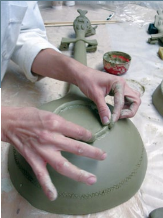
FIGURA 8. Reproducción ▶ de técnica de manufactura: decoración calada en forma de cruz de Malta aplicada a un sahumador.