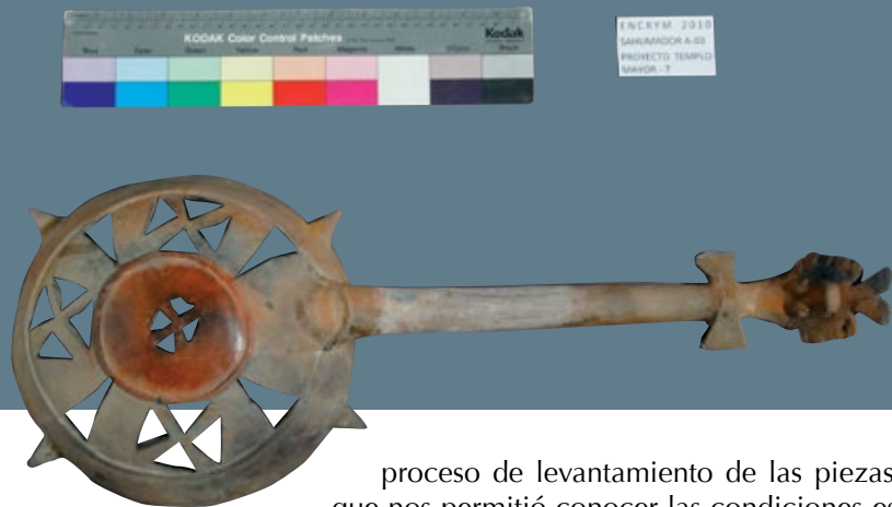
FIGURA 2. Vista general del Sahumador A-03 después de la intervención de restauración. ▶

2); asimismo, presentan evidencias de policromía post-cocción. Independientemente de su utilización para la combustión de resinas, este tipo de sahumeros producían un sonido rítmico, logrado por el juego de pequeñas canicas de barro contenidas en el interior del mango hueco.