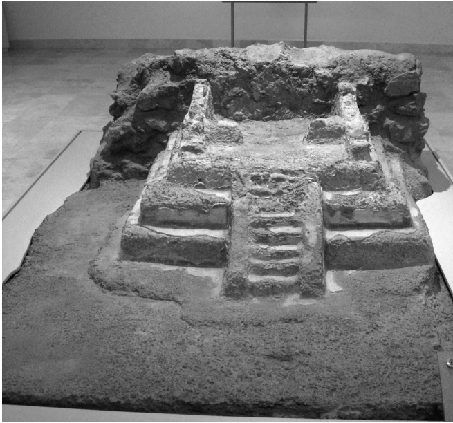
FIGURA 4. Altar que se exhibe en el Museo de Murales Teotihuacanos "Beatriz de la Fuente". (Fotografía en cortesía de Montserrat Salinas).