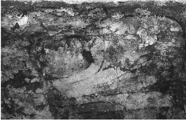
FIGURA 2. Uno de los murales que fue desprendido, donde se aprecia el oscurecimiento y cambios en la textura de la capa pictórica.

de ser intervenidos ya era, según Gaytán, deplorable. Describe que los aplanados se encontraban muy frágiles y quebradizos, presentaban separación de repellido en muchos puntos, grietas, y calcula que la decoración se había perdido en 25%. Asimismo, se reporta que el develado fue muy lento, ya que las pinturas “no tenían aplanado, sino una lechada de cal” (Gaytán 1964:3-4).