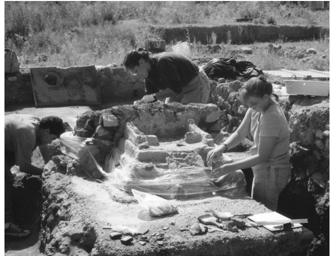
FIGURA 3. Preparación para el desprendimiento de altar en La Ventilla.