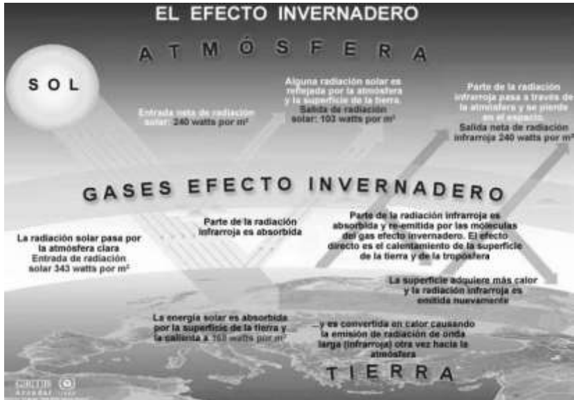
Imagen No. 1: Modelo General de transferencia de calor en el planeta