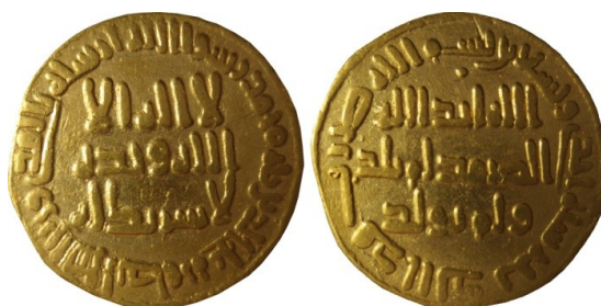
Figure 1 : dinar omeyyade, sans nom d'atelier, 91 ah (709-710), 4,2 g / 20 mm. Walker 202, Lavoix 220. Ech. 2:1.

Résumé : La découverte en Languedoc d'un dinar omeyyade et d'une imitation carolingienne d'un dinar abbasside nous invite à réviser l'idée que nous commençons à nous faire de la circulation des monnaies arabes en Narbonnaise. En effet, s'il est possible que la première monnaie soit arrivée avec les troupes d'al-Andalus qui ont fait la conquête de Carcassonne en 725, on peut aussi avancer l'hypothèse d'une arrivée plus tardive, à la fin du VIII e siècle, par un courant d'échanges venant de Méditerranée ou d'Italie du Nord.