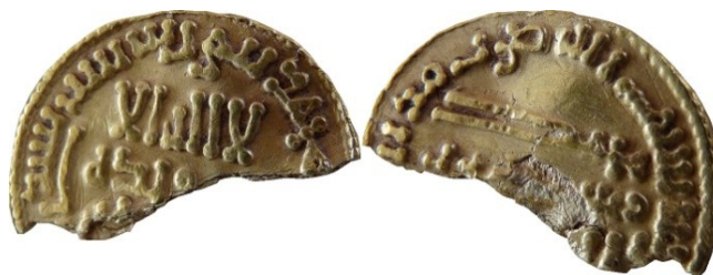
Figure 3 : solidus mancusus, imitation carolingienne du dinar 'abbasside d'al-Mansur, daté 157 ah (774), 1,86 g / 19 x 9 mm. Ilisch 2004, groupe I. Ech.2:1.

Il s'agit d'une demi-monnaie d'or (cf. Fig. 3), assez endommagée, dont la découpe très inégale suggère qu'elle n'a pas été volontairement coupée en deux, mais plutôt brisée peut-être par des travaux agricoles.