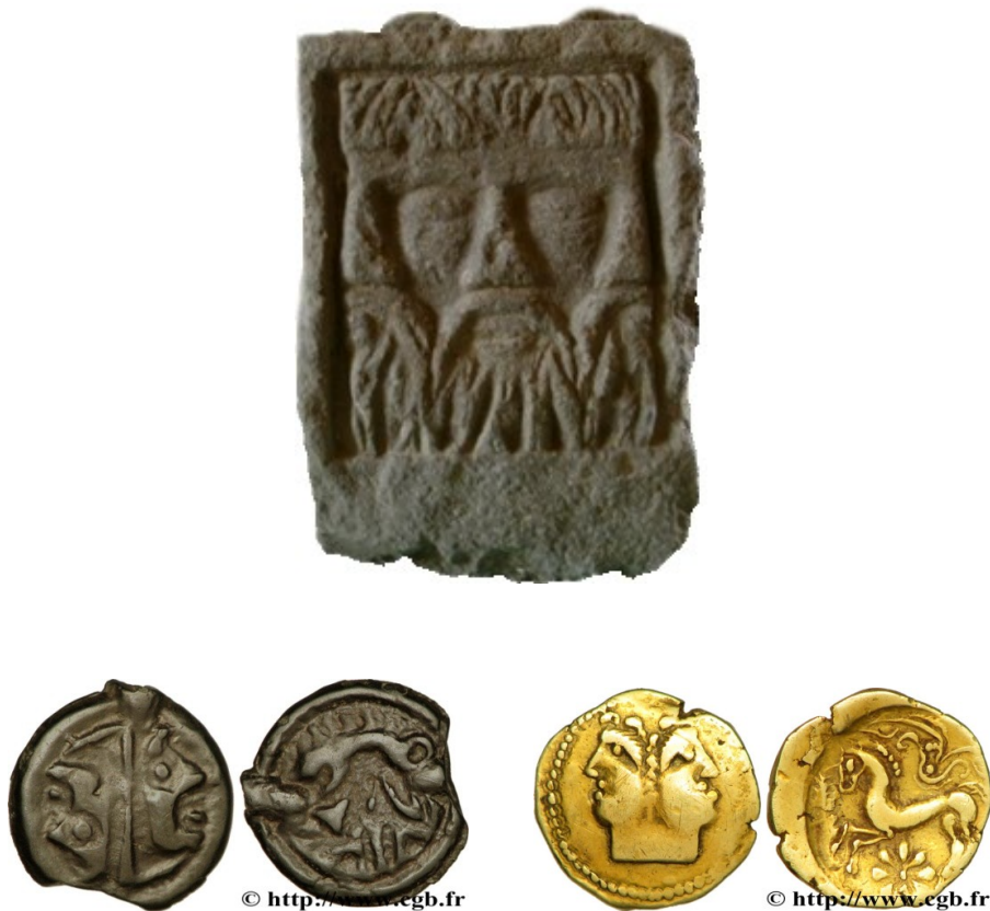
Figure 5 : En haut, autel tricéphale, où les visages se fondent les uns dans les autres. Musée de Reims. En bas à gauche, potin Lingon, avec deux visages tête-bêche au droit, séparés par un bandeau vertical (2,58 g ; CGB.fr bga_279595). Quart de statère des Médiomatriques, avec deux visages fortement expressif qui fusionnent au niveau du cou (1,85 g ; CGB.fr v43_1193).

Un excursus s'impose ici à nous, sur l'« exaltation de la tête » 35 chez les Celtes, que l'on retrouve dans les effigies de leurs dieux. En effet, on trouve de nombreuses représentations de dieux sans corps, de têtes sculptées constituant un motif sculptural fini, souvent sans aucune trace de cou. Pierre Lambrechts remarque que dans la sculpture gallo-romaine en général, la tête est disproportionnée par rapport au reste du corps, l'attention de l'artiste se concentrant sur la tête et négligeant le reste. En cela, il reprend l'étude intéressante de Reinach 36 qui avait étudié les représentations de têtes coupées, trophées de victoire, exprimant l'idée de la domination du vainqueur sur l'âme même du vaincu après sa mort, la tête étant considérée comme la partie essentielle de la personne humaine, et le siège de son âme. Néanmoins, Pierre Lambrechts va plus loin en étudiant la tête de manière générale, et non plus sous l'aspect de tête coupée. Il porte un intérêt justifiable au nombre impressionnant de têtes humaines, ou de blocs bicéphales et tricéphales (Fig. 5) retrouvés en Gaule et en Grande-Bretagne. Celles-ci seraient des représentations, selon lui, d'une divinité déterminée, soit sous une forme simple, soit sous une forme de « répétition d'intensité », soulignant la toute-puissance du dieu.