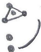
Figure 4 : Schématisation du visage, celui ne se résumant plus qu'à un croissant attaché à deux globules superposés, et à un triangle bouleté qui clôt le haut du visage.

Est-il licite, dans le cas présent, d'emprunter à Paul-Marie Duval sa notion de « délire graphique » 15 ? Le « délire graphique » se « caractérisant par le recours systématique à l'expression abstraite qui renforce la transformation positive et facilite la création puisqu'elle est détachée de la