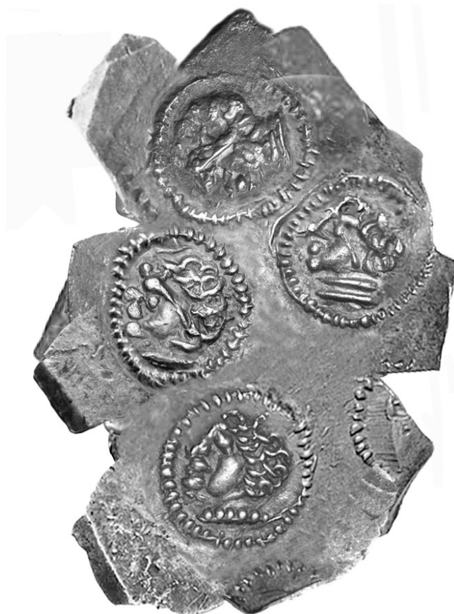
Figure 2 : Reconstitution d'empreinte d'avers du type « au sanglier » (Lopez, 2014)

Cette reconstitution, réalisée dans le cadre d'un travail de caractérisation sur le trésor de monnaies « à la croix » et assimilées de La Sancy (Lopez, 2014a), dévoile l'existence d'un coin monétaire sur lequel était gravé au moins 6 têtes différentes, dont deux demeurent incomplètes sur notre REE (à droite, et en bas). Cette reconstitution est remarquable par les différences de gravures notables entre les bustes (collier de perles, torques ou sans bijoux), le traitement du visage (points, points et traits) et d'orientation (selon l'orientation de notre image, la tête du haut est tournée vers le bas alors que les autres sont à gauche). Ce sont autant de curiosité qui nous ont menées à réaliser une étude iconographique de cette empreinte.