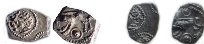
Figure 1 : Deux exemplaires de monnaies d'argent « au sanglier » montrant l'utilisation d'un coin multimonétaire. A gauche Musée Fenaille – Rodez Coll. SLSAA n°29 (2,40 g) et à droite Monnaie de Paris n°129 (2,14g)

Ces constatations ont impliqué la définition de la méthode de reconstitution d'empreinte (notée RE) assistée par ordinateur (Lopez, 2011) dont l'objectif est de restituer la totalité de l'empreinte telle qu'elle aurait pu apparaître sur un flan assez large pour accueillir la totalité de la gravure du coin monétaire. Rappelons que le processus de RE est composé de 3 étapes : 1) la collecte des photographies de monnaies, 2) le classement des photographies dont les monnaies proviennent d'un même coin monétaire (par la méthode de caractérisation (Colbert de Beaulieu, 1973)), 3) la reconstitution d'empreinte consistant à superposer précisément les photographies deux à deux, selon les motifs communs. Pour plus d'informations à ce sujet, le lecteur pourra se référer à (Lopez, 2014b).