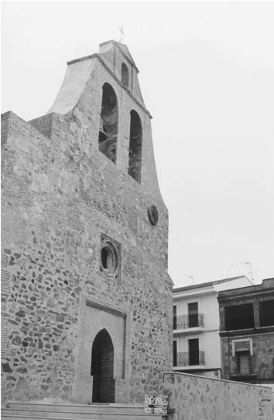
FIG. 2. Detalle del nuevo atrio desde el que podemos apreciar la preeminencia de este elemento arquitectónico en el conjunto exterior del templo.