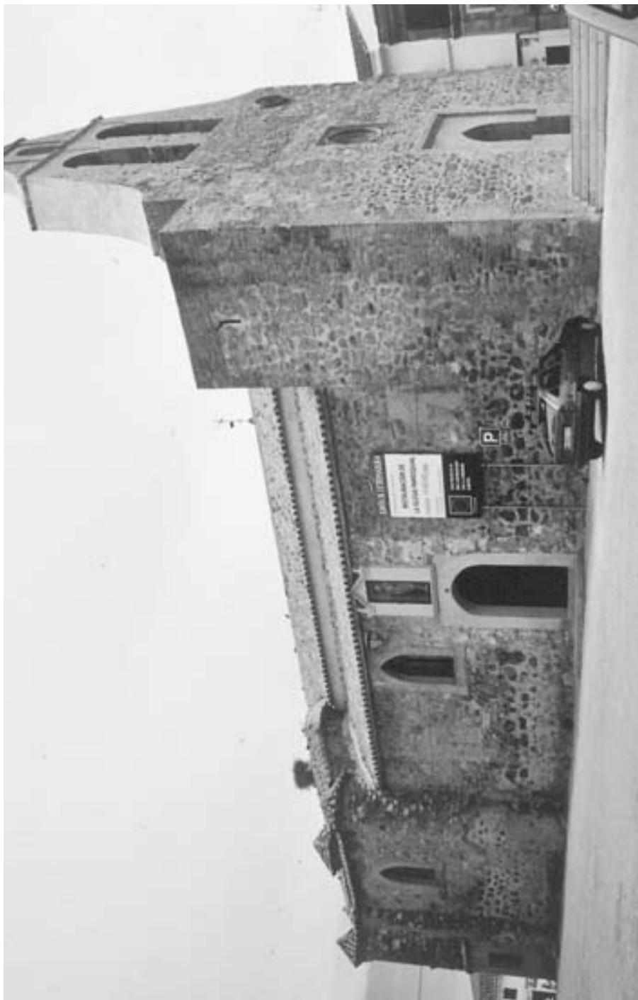
FIG. 1. Imagen actual del templo una vez eliminada la casa parroquial del acceso oeste.