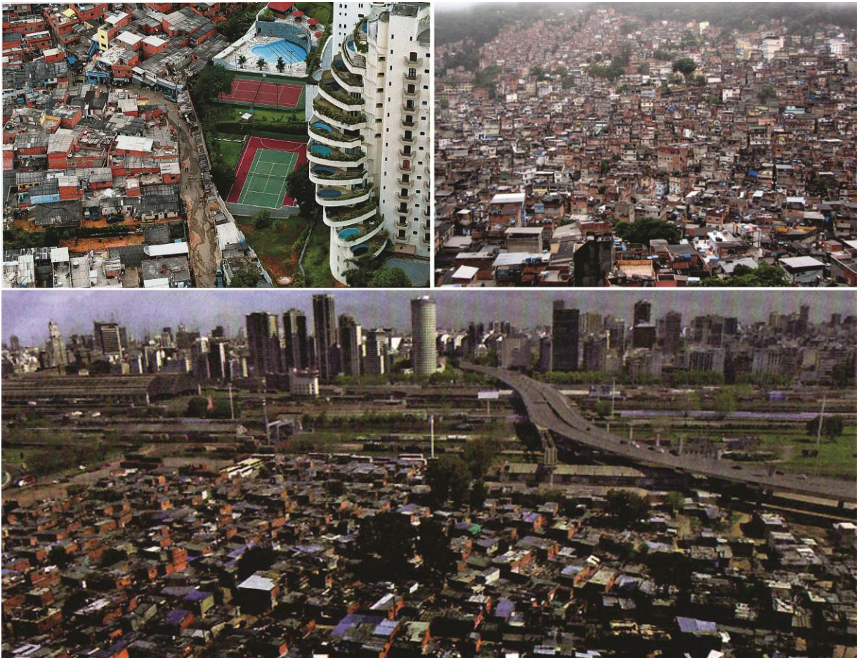
Figura 4. Paisajes de la desigualdad se repiten en los distintos continentes. Superior izquierda: Favela Paraisópolis en San Pablo, Brasil. Superior Derecha: Bombay, India. Inferior: Villa 31-Buenos Aires, Argentina