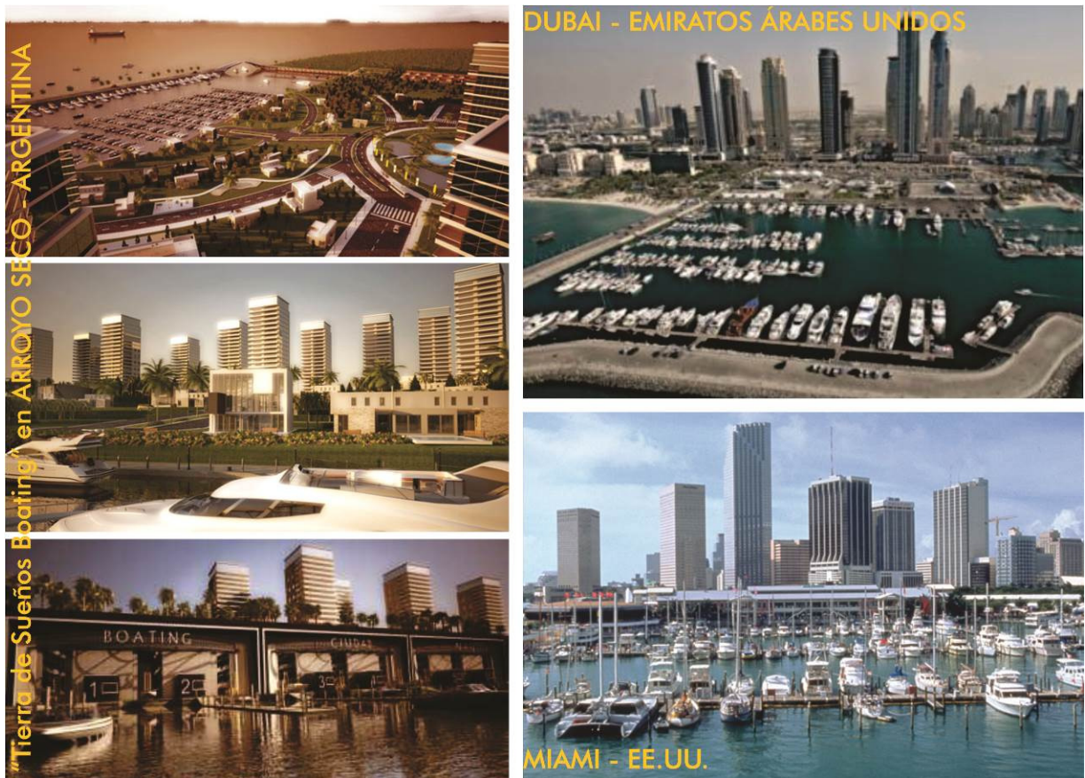
Figura 1. Paisajes homogeneizados en la expansión de la globalización: Dubai (Emiratos Árabes), Miami (Estados Unidos) y Arroyo Seco (Argentina)