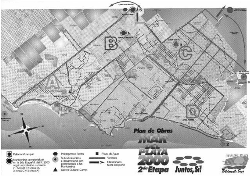
Folleto del Plan de Obras Mar del Plata 2000