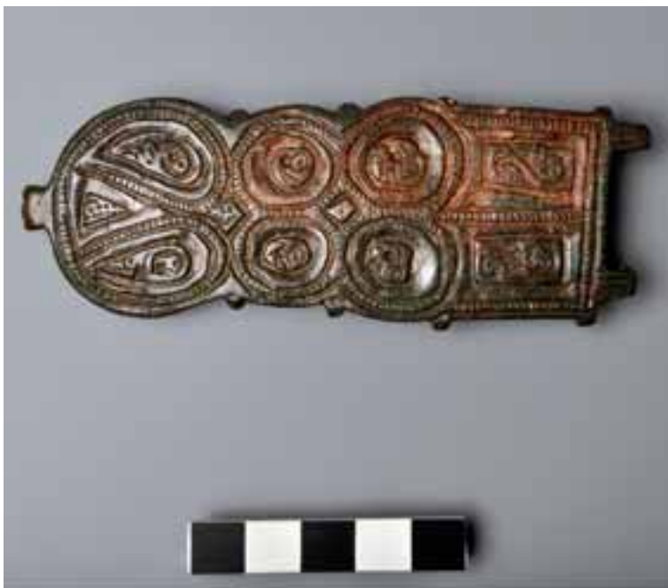
Fig. 4. Sivella visigoda, segona meitat de segle VII-inicis del segle VIII.

cèntric. Les façanes s'obren al carrer que circumda la plaça, les parts posteriors de les cases s'adossen a la muralla, utilitzant-la com a mur de tancament posterior. L'edifici exempt situat a la plaça central i l'excavat a la primera campanya, al no tenir elements com llars de foc o sitges, que fins ara s'han documentat en tots els àmbits excavats, podrien funcionar com a zones d'emmagatzematge, possiblement fossin llocs comunals. Diem magatzems perquè durant l'excavació d'aquests espais tampoc es va recollir ni documentar cap element que denoti cap activitat productiva.