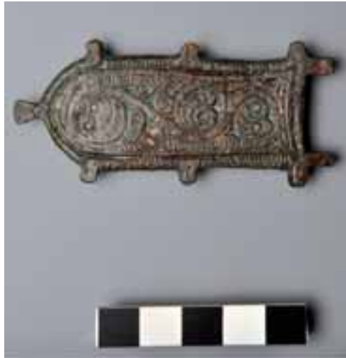
Fig. 3. Sivella visigoda, segle VII.