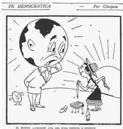
Tomada de Intermedio , Bogotá, sábado 11 de mayo de 1957, p. 4

pete' aprovecha la oportunidad que le brinda “de domingo a domingo” 13 , dedica dos de las seis viñetas a ilustrar momentos esenciales de la reciente caída del general. La que corresponde al tercer recuadro hace referencia al combate mitológico entre David y Goliat. El David en representación de los estudiantes que con la honda en la mano derecha y un libro en la izquierda enfrenta y vence al gigante Goliat, este después de asediar a los ejércitos o al país es derrotado y muere decapitado con su propia espada; en este caso al ser depuesto por el mismo pueblo que le dio el poder el 13 de junio del 53, por entre el yelmo que lleva el gigante para proteger la cabeza se reconoce claramente el rostro del dictador Rojas (figura No. 3).