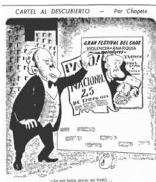
Figura No. 19. Cartel al descubierto