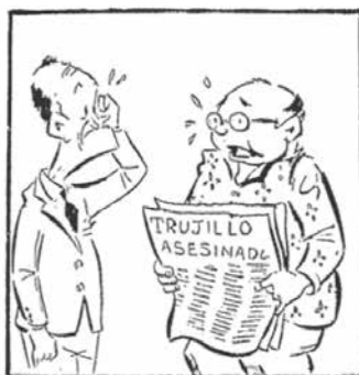
Pérez Jiménez: —Mala noticia, Gustavo: nos quedamos sin “benefactor”...