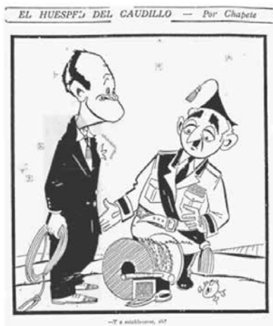
Figura No. 7. El huésped del caudillo