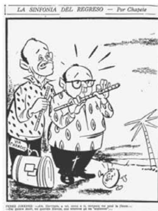
Figura No. 14. La sinfonía del regreso

Tomada de El Tiempo , Bogotá, martes 9 de septiembre de 1958, p. 4