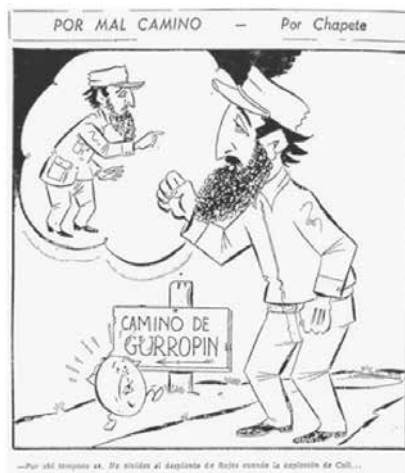
Figura No. 16. Por mal camino

El Tiempo , Bogotá, miércoles 9 de marzo de 1960, p. 4