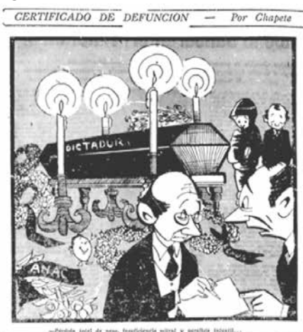
Figura No. 6. Certificado de defunción