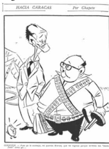
Figura No. 15. Hacia Caracas