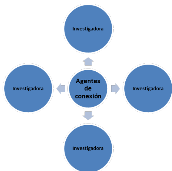
Figura 1 Esquema de la red de conocimiento primera Etapa. .

Como se aprecia en la figura 1 el agente conector se vincularía con las investigadoras por ejemplo en la unidad académica "X" del área 5 Ciencias Sociales para iniciar la red.