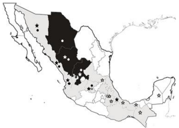
Figura 2. Distribución de BCMV y BCMNV en regiones productoras de frijol en México. En negro se indican los estados en los que se cultiva frijol bajo condiciones de temporal, y en gris en los que se hace con humedad residual o riego. Los círculos y estrellas indican la presencia de BCMV y BCMNV, respectivamente; en blanco y negro se indican los muestreos realizados en 2003 y 2012, respectivamente (Flores-Esteves et al. , 2003; Lepe-Soltero et al. , 2012).

Subsequent reports on the distribution of BCMV and BCMNV, also based on symptoms indicated the presence of the first in the states of Guanajuato (Montenegro, 1970), Puebla (Díaz-Plaza et al. , 1992), Veracruz (López-Salinas et al. , 1994) and Sonora (Jiménez-García and Nelson, 1994). However, in 2003 with the use of RT-PCR using specific primers for each viral species, the PMGF from INIFAP in collaboration with CINVESTAV, Irapuato, detected the presence of BCMV and/or BCMNV in 15 producing states of bean (Flores-Esteves et al. , 2003). Later in 2012 both viruses were detected in four of five evaluated states (Lepe-Soltero et al. , 2012) and in Guanajuato, where only have been detected BCMV and BCMNV (Figure 2) (Flores-Esteves et al. , 2003; Lepe-Soltero et al. , 2012) probably due to the introduction of infected seed that could come from Nayarit and Sinaloa.