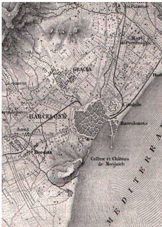
Figura 2 - Mapa de Barcelona

la ciudad propiamente dicha está sentada no bordo del mar, a la base oriental de la roca de Montjuich, erizada de fortificaciones amenazadoras, que vomitaron hierro más veces sobre los Barceloneses mismos que sobre los enemigos. Además, una poderosa ciudadela, igual en superficie a un tercio de la ciudad, la controla del lado del este. Sin embargo, la ciudad es muy alegre, mismo bajo esas baterías que podrían reducirla en cenizas. (p. 837)