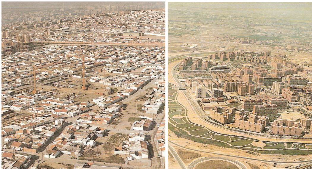
Figura 1. Barrio de Palomeras antes y después de la remodelación. Fuente: Villasante et al., 1989.

El proceso de remodelación de barrios de Madrid es un éxito incuestionable en cuanto a sus cifras: remodelación de 28 barrios, con sus correspondientes equipamientos (incluidos tres grandes parques), 150.000 vecinos alojados en 40.000 viviendas, con una media de 100 m 2 de superficie (UNHABITAT, 1996). Sin embargo, hay algunas sombras: los nuevos barrios son casi exclusivamente residenciales y carecen de soporte para actividades productivas que puedan ofrecer empleo a los vecinos, mientras que las nuevas viviendas corresponden exactamente a los estándares burgueses de la época, incluso los superan, pero muchas veces no responden a las necesidades y capacidades de sus ocupantes que tienen dificultades para adaptarse a un nuevo estilo de vida o para mantener adecuadamente las viviendas (Villasante et al., 1989). Pero el principal problema es que no hay solución para las generaciones más jóvenes: los hijos de los realojados tendrán el destino que sus padres consiguieron esquivar y acabarán expulsados al extrarradio por el mercado inmobiliario.