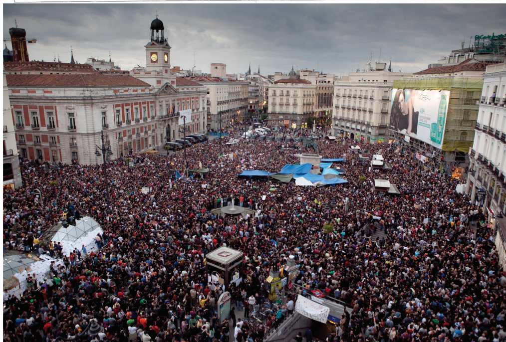
Figura 3. #acampadasol (mayo-junio 2011) Arriba, mapa de la acampada en su tercera semana (elaboración colectiva). Abajo, concentración del 18 de mayo.

A lo largo de la historia del movimiento se han probado todo tipo de fórmulas con resultados muy diversos (Pruijt, 2004; Martínez López, 2010). En general, la respuesta institucional ha consistido en aumentar la represión legal, al tiempo que se lanzaban campañas mediáticas de deslegitimación y criminalización de los okupas. Sin embargo, los resultados de esta represión también han sido variados: en España, el periodo de mayor auge de las okupaciones se inició en 1996 con su penalización, después de una década de ser un movimiento minoritario e ignorado (Martínez, 2007).