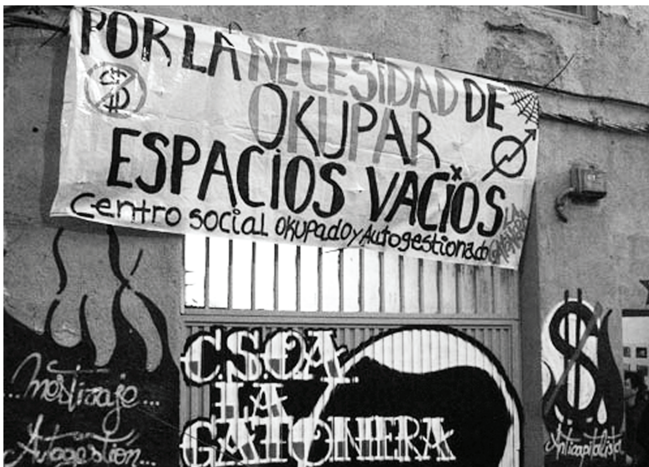
Figura 2. Centro Social Okupado Autogestionado "La Gatónera".

Se pueden distinguir distintas fases en la evolución de los Centros Sociales (Martínez López, 2007) que se han ido abriendo progresivamente a la participación externa y a la cooperación con otros movimientos sociales. De hecho, los Centros Sociales okupados se han convertido, en la práctica, en infraestructuras básicas para campañas de lucha social de muy diverso alcance, entre las que cabe destacar las movilizaciones contra los eventos de 1992, el movimiento anti-globalización a partir de 1999 o la campaña contra la guerra de Iraq en 2003. Particularmente, en Madrid, y probablemente asociado a la debilidad del movimiento en la ciudad (mucho menos potente que en Bilbao o Barcelona, por ejemplo), se han dado hibridaciones interesantes que han promovido una mayor integración del movimiento con otros colectivos y con la sociedad en su conjunto. Así hay Centros Sociales que han realizado una aproximación a las AA.VV. tradicionales, buscando una mayor imbricación con el tejido social del barrio en el que se asientan, mientras otros se han enfocado más hacia el mundo del arte y la cultura obteniendo una visibilidad extra, o hacia las nuevas tecnologías de la información abriendo nuevas posibilidades de comunicación (Adell y Martínez, 2004). La madurez del movimiento ha intensificado una de sus características fundamentales, la diversidad ("cada okupación es un mundo"),