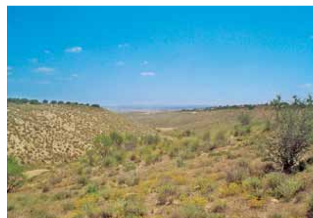
Figura 3. Paisajes con escasa influencia humana y escaso valor estético. Fotografía del autor, mayo de 2008.

características, en la medida en que permite obtener información sobre el valor del paisaje. No parece acorde la simplificación que se realiza de la calidad, que trata de eliminar el componente subjetivo y se limita a considerarla como intrínseca objetiva, puesto que la exclusión de la subjetividad conlleva a la eliminación de la percepción.