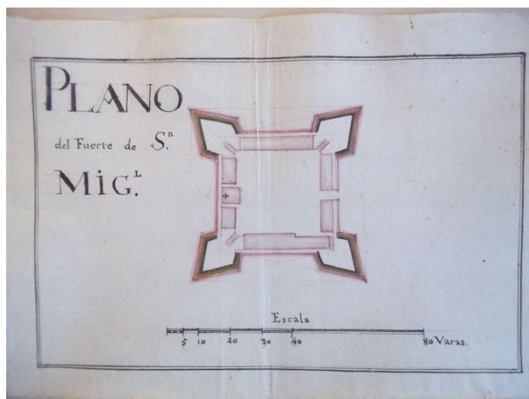
Plano de fuerte de San Miguel elaborado por Juan Bartolomé Howel

P.AL.P de VS. los Capitanes y Chasiques y nombre de todos ellos."