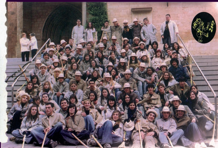
Fotografía de la Quinta 2007, en las escaleras de Santo Tomás. Tradición de obligado cumplimiento.

los y apoyándolos en un ceremonial importante para ellos: han alcanzado la mayoría de edad, ya son adultos y adquirieren responsabilidades: incorporación al mundo laboral directamente o a través del estudio para una preparación más amplia.