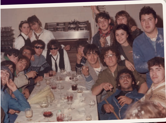
Desayuno y subida al castillo, al que actualmente no se puede acceder por el peligro que implica, Quintos 1985.