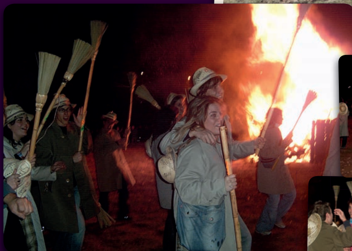
Bailando alrededor del fuego y por las calles. Quintos 2007 y 2012.