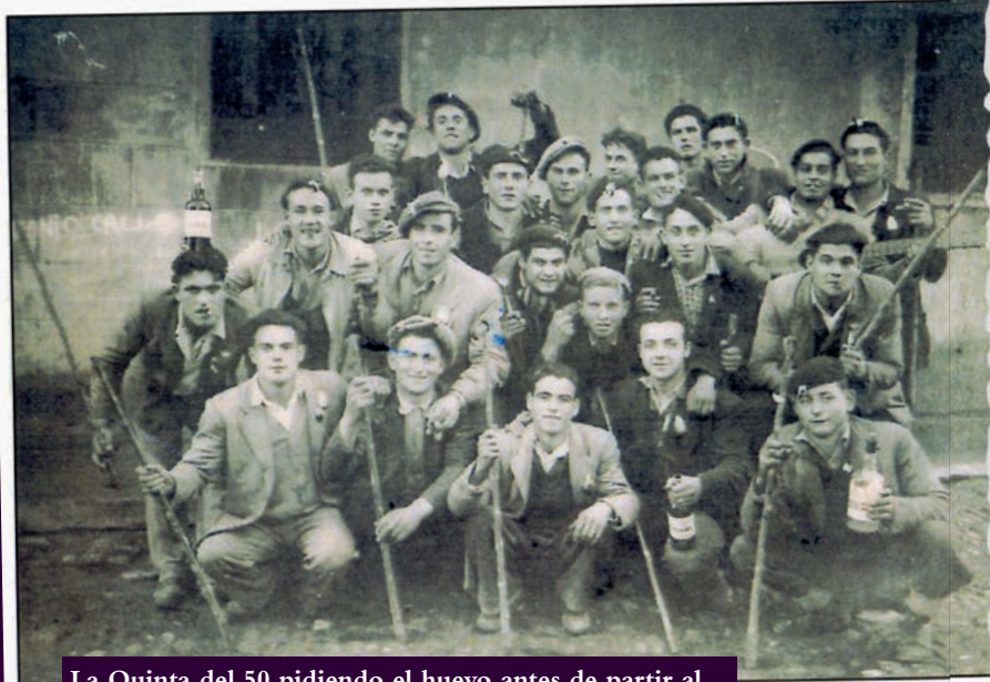
La Quinta del 50 pidiendo el huevo antes de partir al servicio militar.