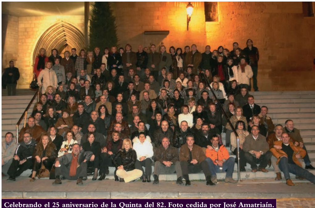
Celebrando el 25 aniversario de la Quinta del 82.

función que el primero tuvo como lugar de acuartelamiento de tropas antes de partir a la batalla y, segundo, que ceremonias y ritos de purificación heredados de épocas precristianas pudieron celebrarse en el entorno bélico de la Edad Media bajo la advocación de Virgen del Castillo. Además, es patrona del Cuerpo de Infantería desde 1585. Por todo ello, no es de extrañar que vaya unido a la celebración religiosa.