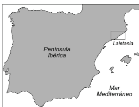
Figura 1.- Localización de la Laietania respecto la Península Ibérica

Habida cuenta de las numerosas comunicaciones dedicadas a la Laietania en esa sesión vamos a tratar de exponer el poblamiento de este pueblo ibérico des de una óptica distinta. De hecho, existen tantos trabajos de carácter arqueológico dedicados a esta zona que podríamos llenar el espacio dedicado a este artículo sólo con bibliografía dedicada a ella. Por ello, nos parece acertado dedicar este espacio a un aspecto concreto de este poblamiento, el cual suscitó, por cierto, algunas controversias durante la discusión posterior a la comunicación. ¿Pero qué mejor que la discusión científica -razonada y fundamentada- para un óptimo desarrollo del conocimiento histórico? Nos referimos en este caso a una tipología de asentamiento que parece propia de este período el cual vamos a nombrar, tanto por su función como por sus características, núcleos de control territorial . Pero para poder entender su naturaleza debemos introducir, aunque de forma breve el contexto histórico y el marco arqueológico en que se ubica la Laietania en este momento.