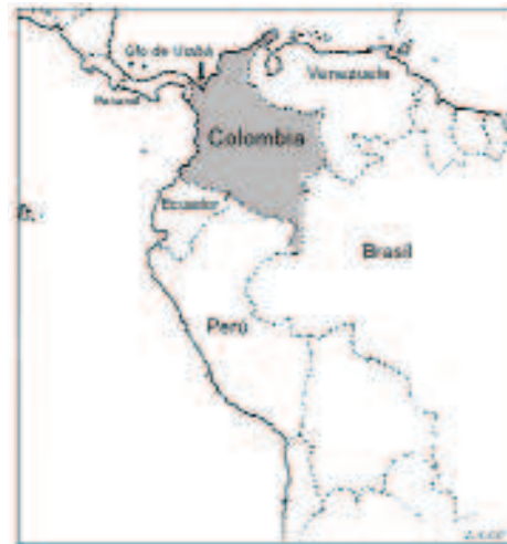
Figura.- 1. Mapa con algunos puntos de referencia regional. (Alzate 2006)

Santa María de la Antigua del Darién es un sitio arqueológico ubicado en territorio colombiano, en la esquina septentrional del continente Suramericano, en la región conocida como el Darién. La zona esta rodeada al oriente por el Golfo de Urabá y al occidente por la Serranía del Darién. Esta serranía sirve como límite natural de frontera entre los países de Colombia y Panamá formando el conocido “Tapón del Darién”, que interrumpe la carretera Panamericana, pero que concentra una gran variedad de flora y fauna única en esta región. En el mapa anexo a este informe se podrá observar una ubicación geográfica general del sitio con relación al continente Suramericano.