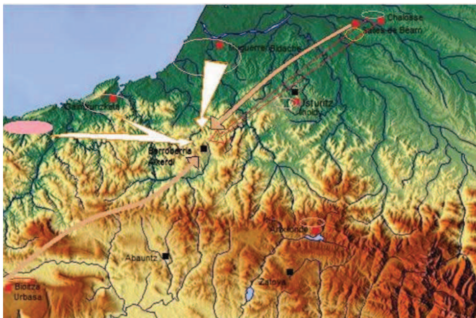
Figura 2.- Mapa de los afloramientos explotados por los ocupantes de Alkerdi (Navarra) durante el Gravetiense. El grosor de las flechas indica la representatividad de dicho sílex en el yacimiento arqueológico, cuanto más ancha en mayor cantidad estará representado entre el material lítico.

En la colección lítica recuperada pudo distinguirse más de un tipo de sílex de diferente procedencia, así como otras rocas. Como resultado del trabajo de identificación y determinación de las procedencias de los sílex obtuvimos un mapa de explotación (Fig.2); donde el sílex de FLYSCH, en sus variedades Bidache y Gaintxurizketa, es el más representado. El afloramiento de Bidache se encontraría cerca de la costa vasco-francesa a unos 30 km. de distancia a vuelo de pájaro de Alkerdi; lo que interpretaríamos como un trayecto asequible, realizable en una jornada de viaje, y por lo tanto resultaría