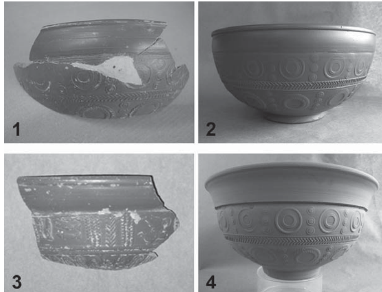
Figura 3.- Decoraciones y orientación del borde. Decoración atenuada hacia el interior en borde cerrado: 1 (Drag. 37, Centro de Interpretación del Acueducto Albarraçín-Cella en Gea de Albarraçín) y 2 (reproducción experimental). Decoración muy marcada y borde con tendencia abierta: 3 (Drag. 37t, Colección de Prácticas Universidad de Zaragoza) y 4 (reproducción experimental).