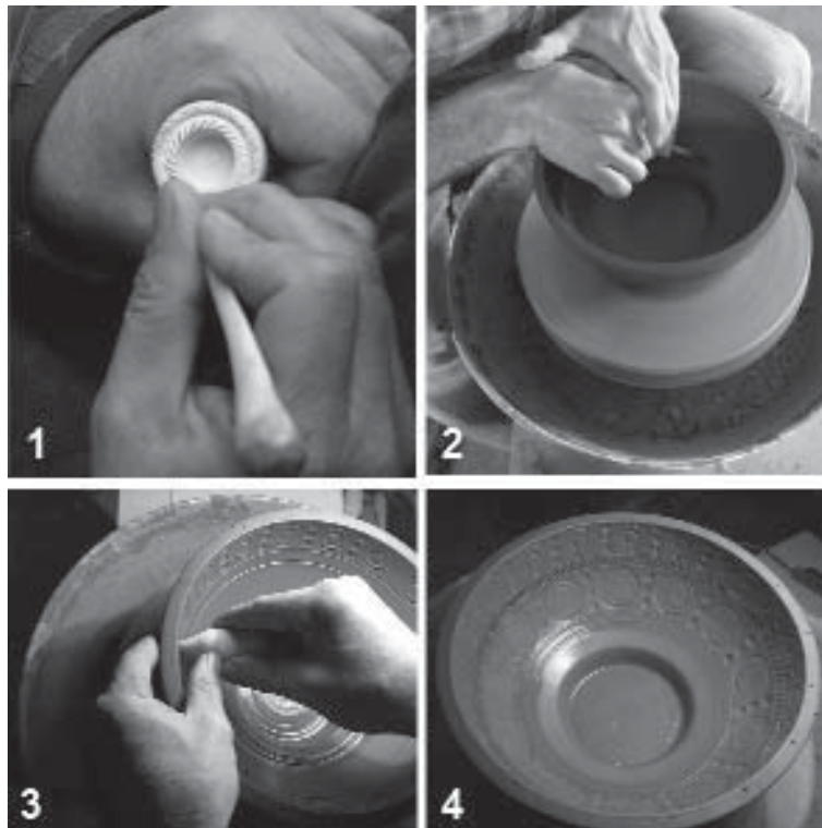
Figura 1.-Fabricación del molde. 1- Fabricación de los punzones. 2- Torneado del molde. 3- Impresión de las decoraciones con los punzones en el interior del molde. 4- Molde terminado.

La verdadera aportación viene en el proceso seguido tras la construcción del molde y durante su uso. Según el programa gestual que proponemos, la pasta no se metería amorfa en el molde, sino que hay que añadir un paso previo en el que se produce a torno la forma deseada coincidente con el interior del molde, con el grosor de pared apropiado y con la altura deseada incluyendo la parte de labio que quedará por encima del molde y que ya no será modificada de grosor, aunque como veremos pueda cambiarse posteriormente la orientación hacia el interior o exterior de la pieza. Esto para un tornero experimentado no supone mayor dificultad y permite dejar preparado un gran número de piezas a la espera de recibir la decoración, lo que encaja perfectamente con el carácter semi-industrial de la TS. Posteriormente y cuando la pieza lisa hubiera perdido la