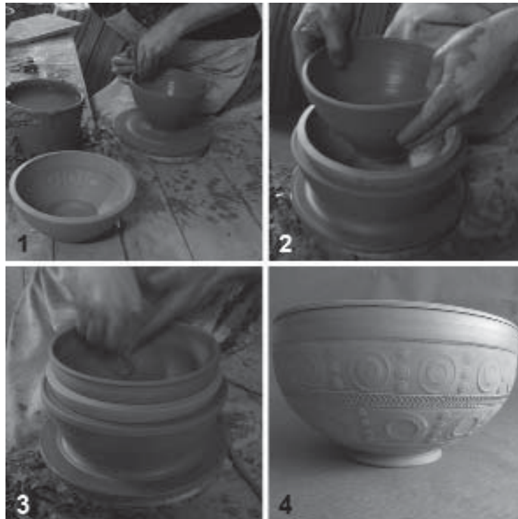
Figura 2.- Fabricación de la pieza. 1- Torneado de la pieza lisa. 2- Introducción de la pieza en el molde. 3- Torneado interior de la pieza que recibe del molde la decoración en su exterior. 4- Pieza formada en crudo y sin engobe.

más abierta (Drag, 37t) se puede continuar con una presión uniforme o incluso intensificada hasta el mismo borde del molde. Este procedimiento tiene implicaciones en la impresión de la decoración que se constatan en los materiales originales y que avalan su posible veracidad. Es frecuente que las formas cerradas tengan la parte superior del programa decorativo ligeramente menos impreso que la parte inferior de los motivos. Por el contrario las formas más abiertas tienen la parte superior de la decoración perfectamente impresa. Probablemente esta consecuencia que la orientación del labio tiene sobre la decoración podría ser evitada con una mayor dedicación y cuidado sobre cada pieza, pero una vez más, el alfar de TS tiene una producción semi-industrial. Así pues si prima la obtención de una forma cerrada, la