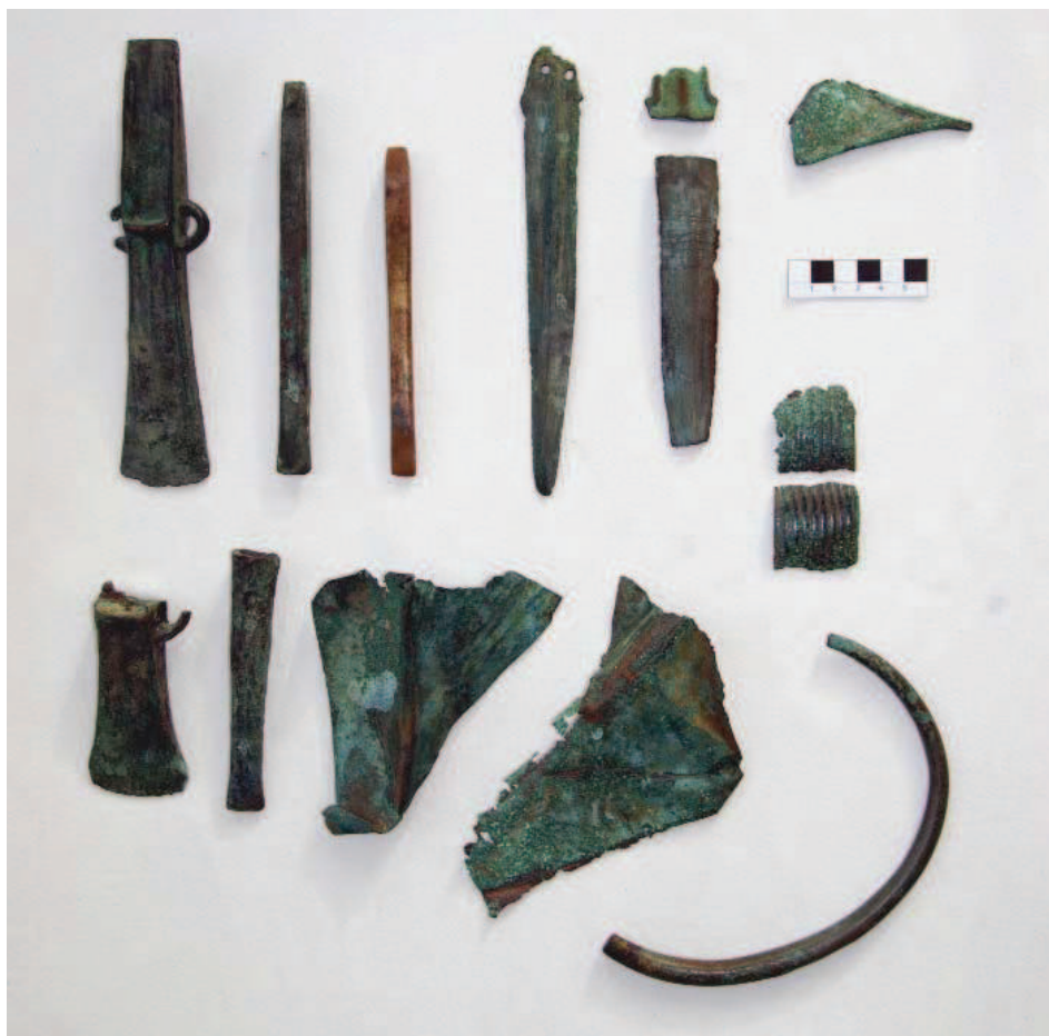
Figura 2. – Fotografia do conjunto de metais de Vila Cova de Perrinho actualmente no Museu Municipal de Vale de Cambra

O conjunto metálico de Vila Cova de Perrinho compõe-se por 12 peças tipologicamente bastante heterogéneas, encontrando-se dois artefactos fragmentados (um punhal e a pulseira).