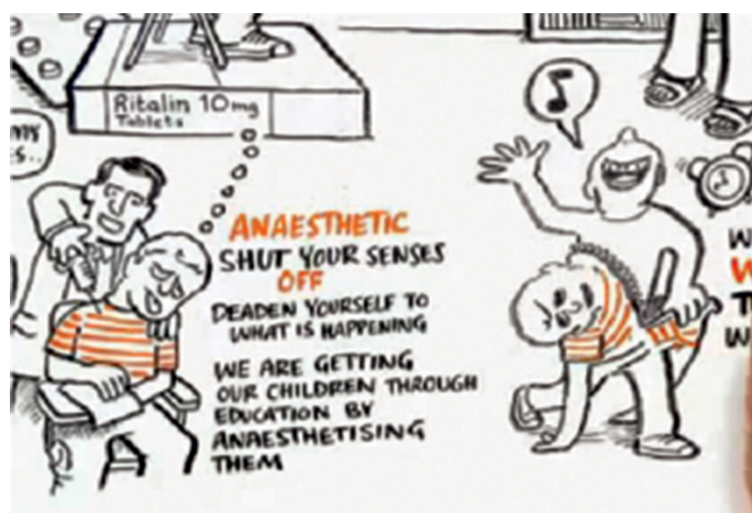
IMAGEN 1 Cambiando paradigmas

Disponible en < http://www.youtube.com/watch?v=-FOKBOuM5Pk >.