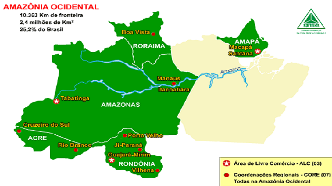
Figura 1 - Mapa da Amazônia Ocidental

A fim de modificar o quadro existente, o Governo Federal elaborou o projeto da ZFM, com a intenção de levar o crescimento e desenvolvimento econômico a esta parte do país.