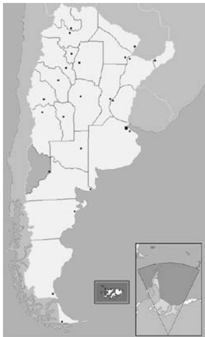
Figura 1: Localización del área de estudio