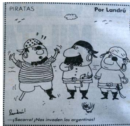
Imagen 2: Piratas

En primer lugar, encontramos una recurrente asociación entre los ingleses y la piratería, tanto en ejemplos en los que éstos van a aparecer directamente encarnados en la figura del pirata (parches en los ojos, argollas en las orejas, patas de palo, remeras rayadas y otros elementos tradicionales de la iconografía clásica) como en otros en los cuales son los buques de guerra los que aparecen emulando la idea de la piratería a partir de la inclusión de la emblemática bandera negra con una calavera. 15