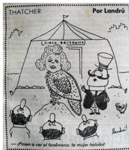
Imagen 19: Thatcher

Una única vez Landrú apela a la añeja tradición que combina la caricatura del rostro con cuerpos de animales. En este caso (Thatcher, 25 maio 1982, p. 12) el rostro de Margaret Thatcher aparece fusionado con el cuerpo de un ave de rapiña construyéndose gráficamente la metáfora de mujer halcón (en alusión a la forma de denominar a los conservadores de la Cámara de los Comunes) que es exhibida como rareza en el “Circo Británico” - imaginen 19 -. En este caso, si bien Landrú tiene una larga tradición de representar personajes políticos a través de figuras de animales 20 no es habitual en su obra, en cambio, la combinación de la caricatura de un personaje con fragmentos de animales.