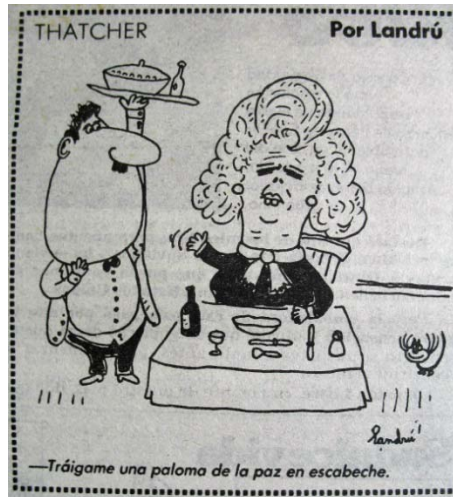
Imagen 18: Thatcher