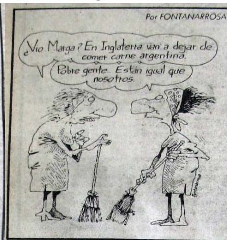
Fonte: Fontanarrosa, 18 abr. 1982, p. 64