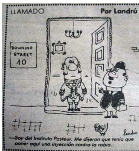
Imagen 7: Llamado

del típico atuendo escocés compuesto de falda tableadas cuadrillé y boinas. Asimismo, y fundamentalmente en el caso de Fontanrrosa, es destacable cómo tanto militares -imagen 11 - como civiles - imágenes 10 y 13 -, tienen una peculiar postura corporal exageradamente erguida, que denota altanería y orgullo lo cual, en este segundo caso, contrasta enormemente con la caracterización de los argentinos. - imágenes 14, 15 y 16 - Sin embargo, esta actitud corporal no se condice con el contenido textual de los cartoons que revierte un componente degradante sobre la imagen de los ingleses, sirviendo en todo caso para generar, mediante el contraste, un efecto irónico.