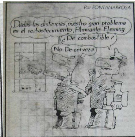
Fonte: Fontanarrosa, 24 abr. 1982, p. 40