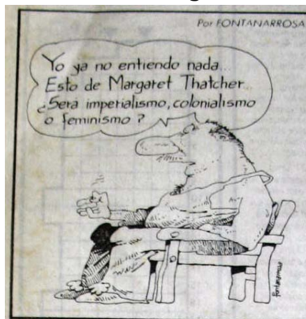
Fonte: Fontanarrosa, 30 abr. 1982, p. 44