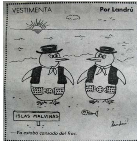
Imagen 1: Vestimenta