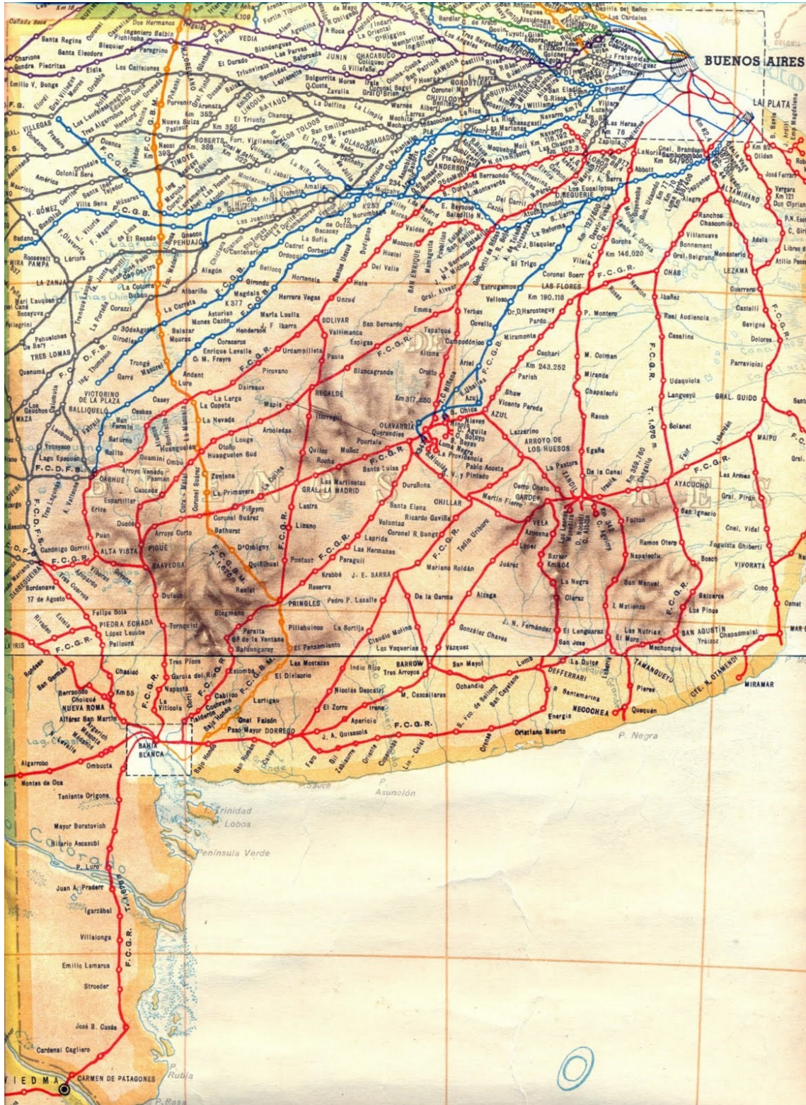
Imagen 2. Provincia de Buenos Aires y su red ferroviaria.