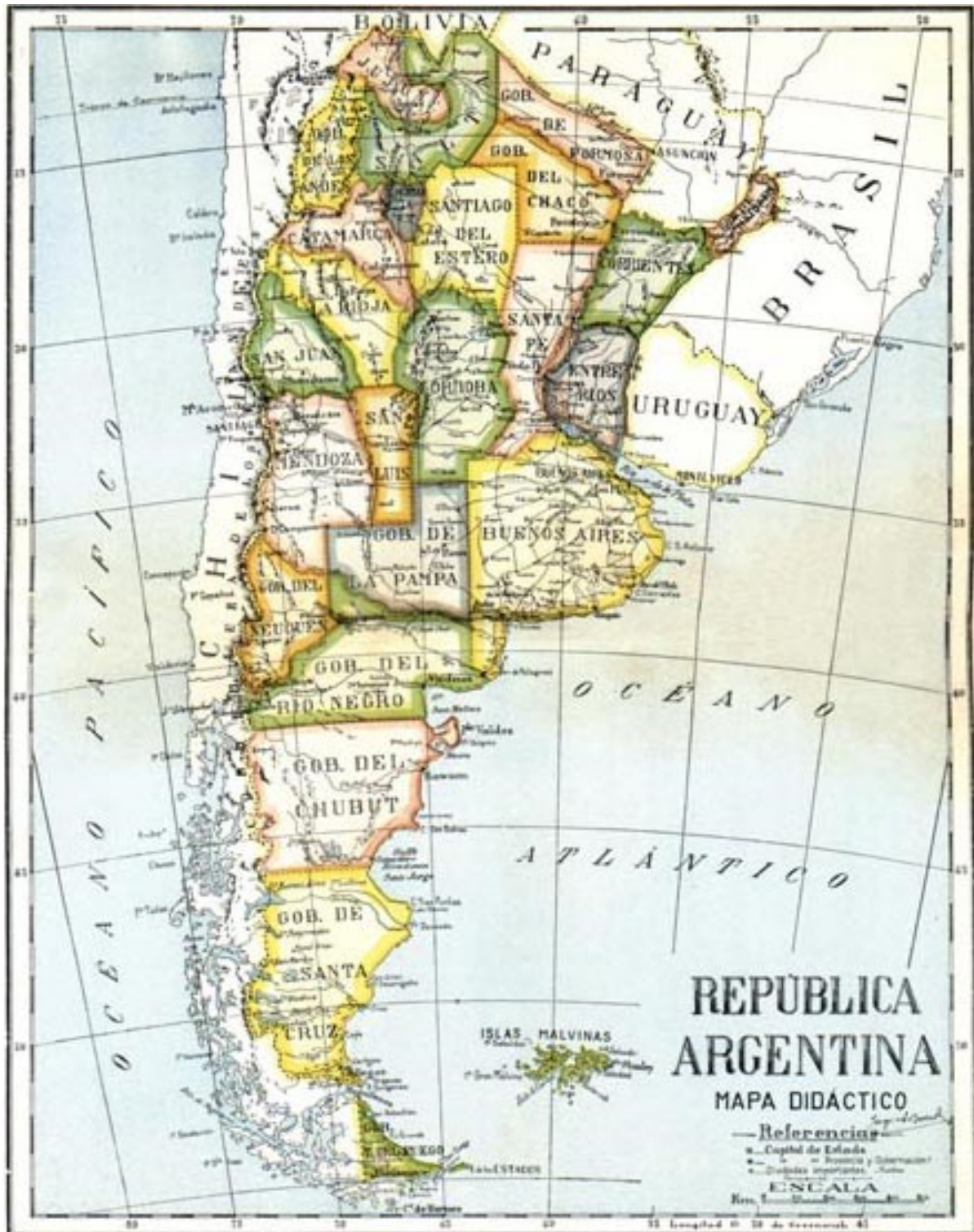
Imagen 1. República Argentina, Mapa Didáctico de 1941