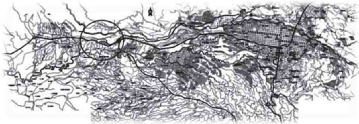
Figura No. 1 - Localización del Plan Parcial la calleja en relación con el "Casco Urbano" del Municipio de Pereira.

Estas estrategias contribuyen al mejoramiento de la zona en materia de espacios públicos, equipamientos colectivos, infraestructura vial y de servicios públicos domiciliarios, aportando de manera efectiva en el mejoramiento de las condiciones de vida del asentamiento humano existente, definiendo el tipo de intervenciones prioritarias que deban hacerse, cuantificando las inversiones y definiendo responsabilidades en el marco de la repartición de cargas y beneficios y de acuerdo a las leyes vigentes.