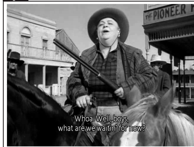
Imagen 1. Vámonos.

se nota una suerte de crescendo a medida que aumenta la violencia y que bifurca desde articulaciones cacareadas o cloqueadas hasta un definitivamente inhumano graznido—todas ellas cada vez más burlonas, ridiculizadoras y arrogantes. En un momento decisivo, cuando se trata de ver quién azotará a los caballos para que las víctimas queden ahorcadas y colgando del árbol, pero que, como era de esperarse, la mayoría de los integrantes de la tropa justiciera se retracta, una vez más Jenny encabeza el liderazgo, no sin censurar, con voz particularmente estruendosa, la falta de hombría en los participantes y lanza el fuetazo a los caballos—cual hombre.