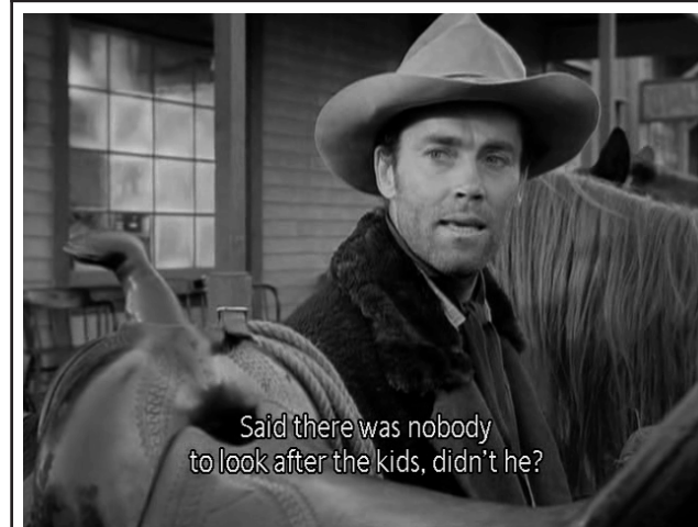
Imagen 7. Otra buena razón.

La conceptualización del cineasta en cuanto a estas mujeres podría dar una idea de cierta realidad social en un pequeño villorrio perdido del Oeste. No hay cabida aquí para una heroína propiamente dicha, sino una serie de caracteres femeninos esquematizados que podrían representar las difíciles condiciones en que muchas de ellas probablemente se encontraban. Sin embargo, estos perfiles de mujer recuerdan que el Oeste no fue ni en sus éxitos ni en sus fracasos un asunto únicamente de cowboys , sino que las mujeres, en las condiciones, situaciones y oportunidades que vivían, formaban una parte de la Conquista del Oeste digna de ser analizada. Personajes ficcionales todas ellas, ya fantasías o espejismos, ya reales , las mujeres de este filme implican la desidealización de la heroína absoluta de Western . A la vez, curiosa e implícitamente, Wellman estaría proponiendo que el espectador integre los buenos aspectos de que carecen, con intención moralizadora, los cuales las mujeres del Oeste deben intentar alcanzar.