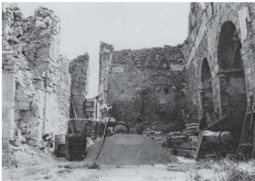
Obres de consolidació de l'església (1985)