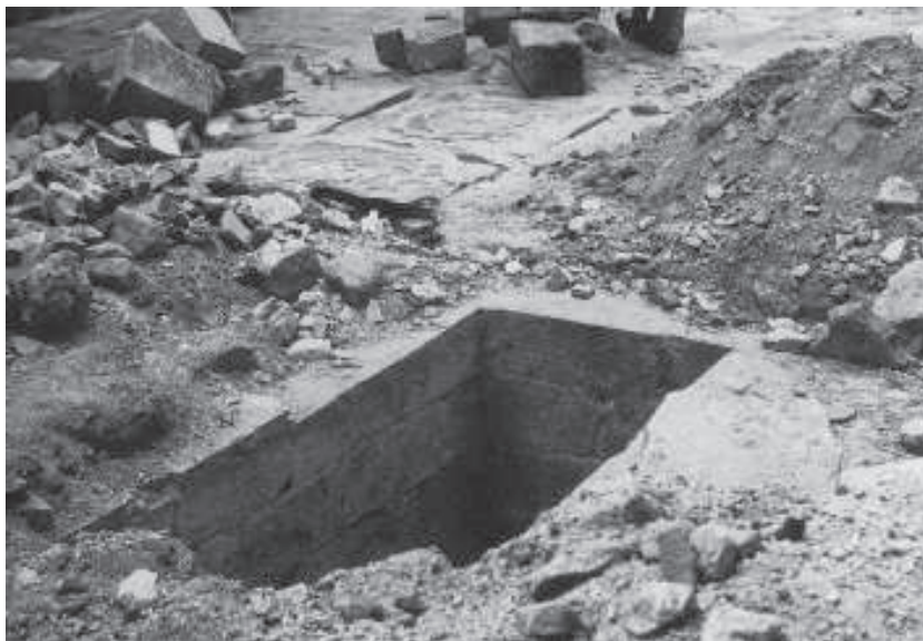
Troballa de la sepultura dels Llorac a l'església del Tallat (1985)