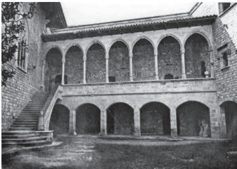
La mateixa galeria, al castell de Santa Florentina, de Canet de Mar