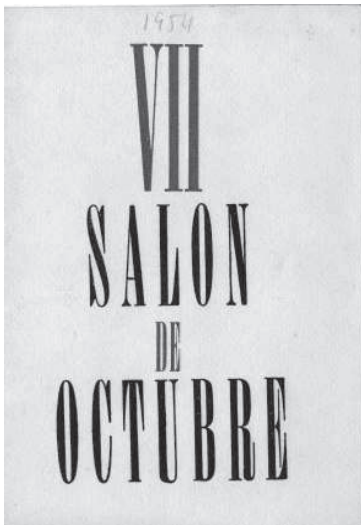
VII Sal6n de Octubre.1954.

Com en el cas precedent, per poder oferir al lector un criteri s6lid, sovint reproduïxen textualment all6 que els mitjans especialitzats detallaven. Aix6, a mode de titular o de frase destacaven alguna expressi6 o qualificatiu, per6 tamb6, en ocasions, hi incorporen el conjunt de l'6rticle, tot aportant-ne el text per a l'an6lisi.