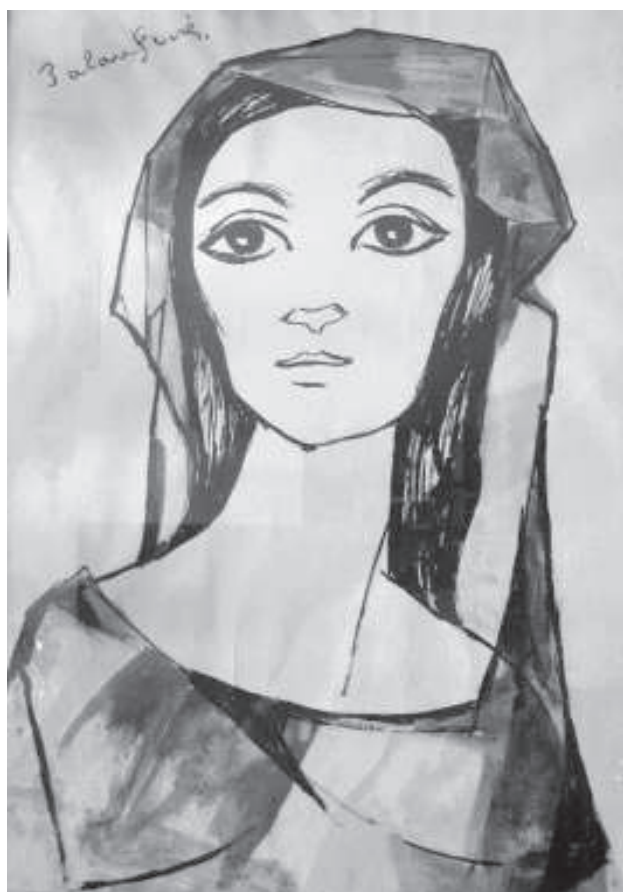
Noia amb vestit de tonalitats