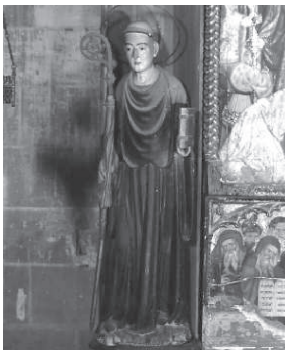
Detall de la imatge de sant Benet. (Foto Carles Aymerich (CRBMC). Museu Diocesà de Tarragona)