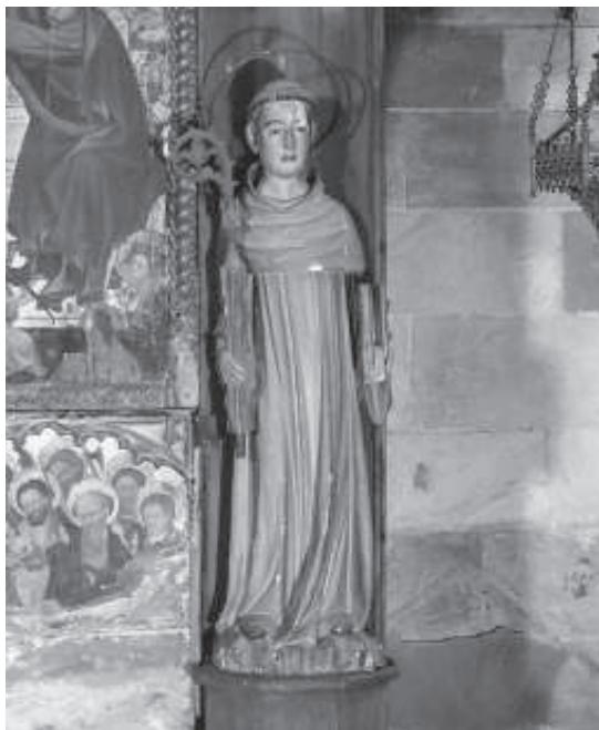
Detall de la imatge de sant Bernat.