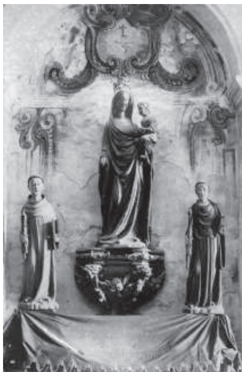
Imatges del retaule major de Santes Creus conservades a l'església parroquial de la Guàrdia dels Prats.