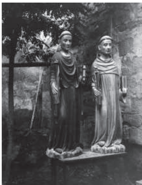
Imatges de sant Bernat i sant Benet a la Guàrdia dels Prats.