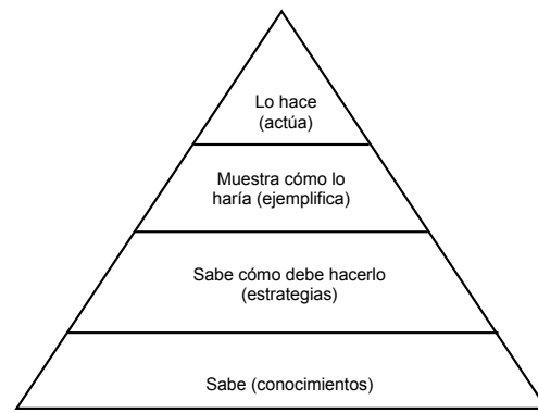
Figura 1. Evaluación del desempeño