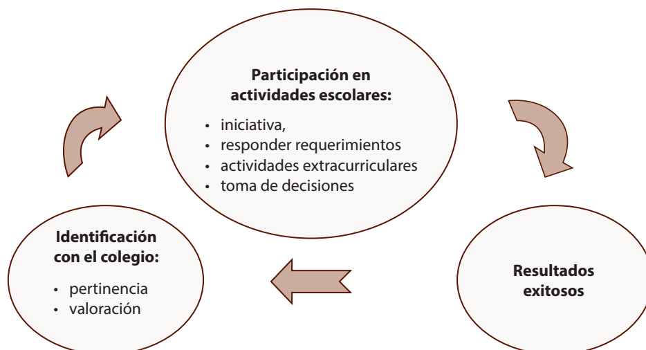
Figura 1. Elaboración propia a partir del modelo de participación-identificación de (Finn, 1993).

El segundo componente del modelo es la participación. Participar de forma activa en clase es la condición mínima para que se dé el aprendizaje formal, pues el estudiantado debe poner atención a su profesor o profesora, leer, estudiar, memorizar, responder preguntas y terminar las tareas (Finn, 1993). Considera que con estos dos componentes (identificación y participación) se crea un “círculo de desarrollo” que refuerza en el estudiantado terminar los estudios y tener éxito académico (ver figura 1).