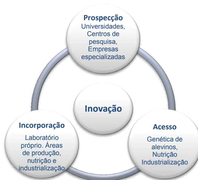
FIGURA 2. O processo de inovação aberta da empresa Mar & Terra

Além dessas parcerias, são realizadas visitas técnicas a países com tradição secular na produção de peixes, como a Índia e China, para identificar conhecimentos e técnicas utilizadas naqueles países e posterior aplicação e adaptação às condições de produção no Brasil. O processo de inovação aberta que a empresa utiliza, conforme ilustrado na Figura 2, baseia-se na prospecção, acesso e incorporação de tecnologias inovadoras em diversas fontes de conhecimento, que representam a base do processo de crescimento e internacionalização da empresa.